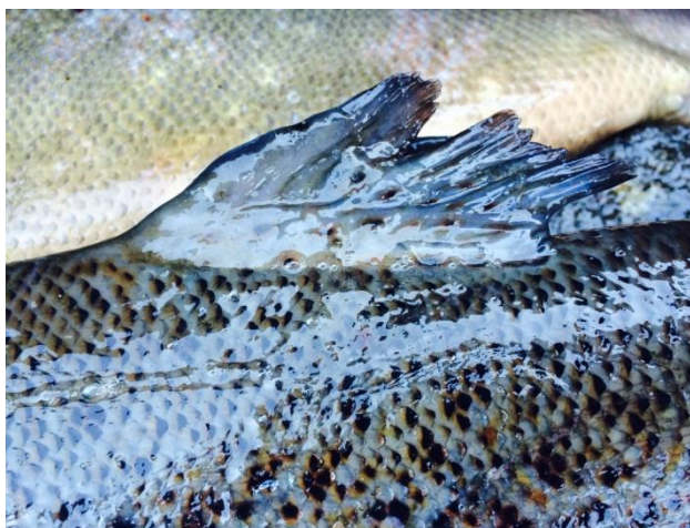
Rømt oppdrettslaks fra Altaelva høst 2014

Et av de styrende bærekraftsmålene for norsk oppdrettsindustri er at rømt oppdrettslaks ikke skal gyte i våre vassdrag, og dermed utgjøre en risiko for villaksens genetiske integritet. Våre organisasjoner har derfor lenge ment at det ikke kan være opp til oppdrettsindustrien selv å bestemme om man skal rydde opp etter rømmingsuhell (og andre miljøpåvirkninger), eller hvor mye denne opprydningen skal koste. Vi mener opprydning skal foretas når rømming skjer, og til en kostnad som bestemmes av tiltakets nødvendige størrelse for å unngå skade på villfisk. Vi er derfor grunnleggende positive til at oppdrettsindustriens miljøfond nå formaliseres, med hjemmel i de siste endringene i Akvakulturloven.