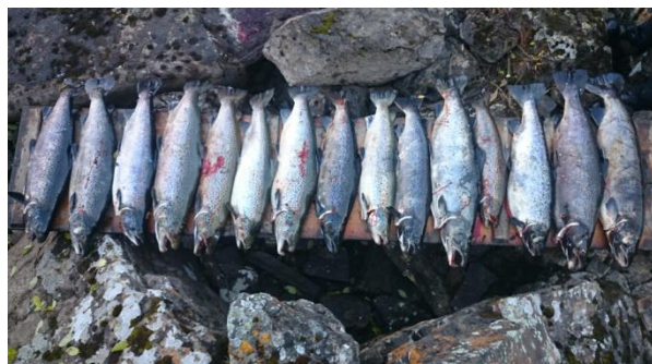
Rømt oppdrettslaks fra Sautso i Altaelva, 2014

Basert på tidligere års rømmingshendelser, og erfaring fra 2013 om mye oppdrettslaks i elva, gjennomførte Alta Laksefiskeri Interessentselskap, ALI, i høst et overvåkningsfiske i hele elva. I hver av sonene Sautso, Sandia, Vina, Jøraholmen og Raipas hadde man ute ett båtlag, hvert med 3 fiskere. Prøvefisket avdekket at det stod svært mye oppdrettslaks opp mot oppvandringshinderet øverst i Sautso. Dette ble ansett som kritisk, da Norsk Institutt for Naturforskning har vist (i