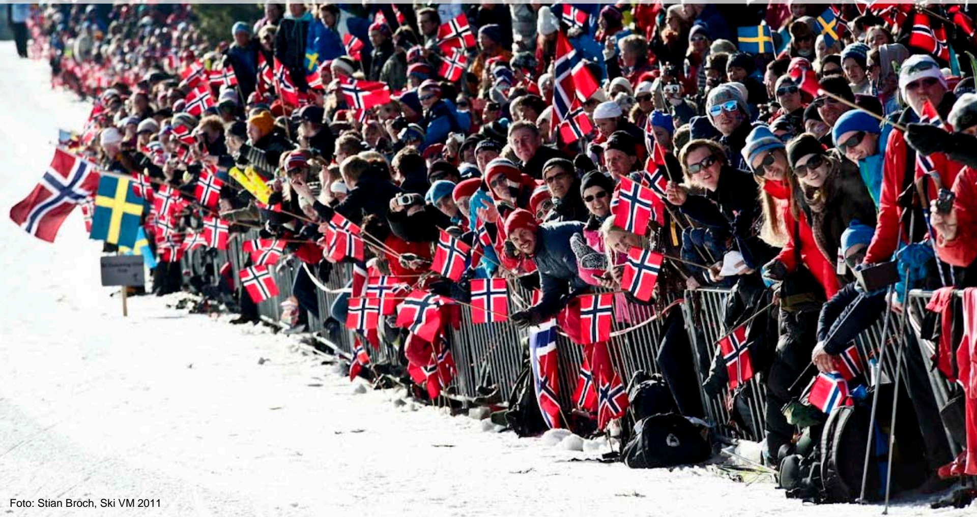
Ski VM 2011