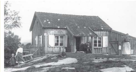
Husmannsplass i Maridalen, 1903. Huset bestod vanligvis av to rom, en stue på ca. 15–30 kvadratmeter med et mindre rom ved siden av. Det viktigste rommet tjente som oppholdsrom, soverom og arbeidsrom. Siderommet kunne brukes som verksted, men kunne også innredes som finstue. De fleste husmennene hadde husdyr og hadde derfor også fjøs og løe for oppbevaring av korn og fôr.

Mange av husmannsplassene i Maridalen ble lagt ned mellom 1875 og 1900. De plassene som er bevart fram til vår tid, er enten blitt selvstendige bruk eller kommunale forpakterbruk. Flere plasser ble i tillegg revet på 1970-tallet, som ledd i saneringsprosessen for å verne om Maridalsvannet som Oslos drikkevannskilde.