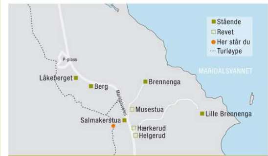
I tillegg til husmannsplassen Musestua skal også plassene Fyllingstua og Brendingseiet ha ligget ved nedkjørselen til Brennenga. Plassen Skrauperud lå i skogen rett vest for Salmakerstua, som er den eneste plassen som fortsatt står i dag. Hærkerud og Helgerud lå ut mot Maridalsveien ved nedkjørselen til Lille Brennenga.