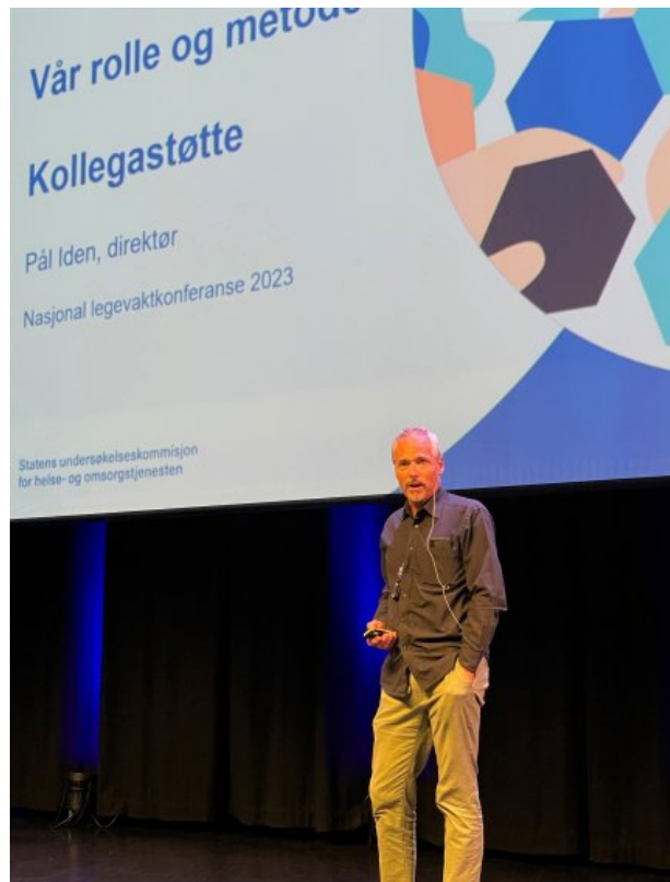
Iden presenterte også vårt arbeid på Nasjonal legevaktkonferanse 2023.

Ukom deltok i 2023 i programkomiteen for den nasjonale pasientsikkerhetskonferansen. Vi bidro på konferansen både med plenumsinnlegg og i parallellsesjon.