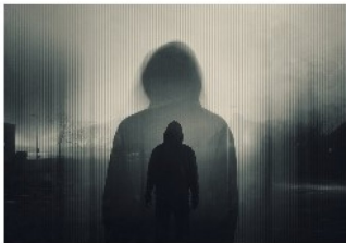
Helsehjelp til personer med alvorlig psykisk lidelse og voldsrisiko

Rapporten peker på faktorer som førte til at en person med alvorlig psykisk lidelse og voldsrisiko gikk «under radaren» og ikke ble fanget opp av helse- og omsorgstjenesten. Funnene viser at det kan være utfordrende å vurdere samtykkekompetanse, både fra faglige, etiske og juridiske perspektiver. Rapporten framhever viktigheten av pårørendeinvolvering i behandlingen, samt ivaretagelse av pårørende. Videre peker rapporten på ivaretagelsen av samfunnsvernet og hvordan uavklarte ansvarsforhold mellom spesialisthelsetjenesten, kommune- og justissektoren kan føre til at pasienter ikke fanges opp. Voldsrisiko må vurderes på bakgrunn av oppdatert informasjon og for å forebygge framtidig vold er det viktig at oppfølgingstiltak bygger på de kartlagte risikofaktorene. I rapporten omtaler vi også viktigheten av å vurdere favevilkåret.