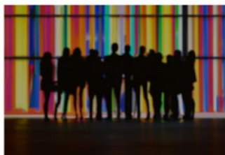
Pasientsikkerhet for barn og unge med kjønnsinkongruens

Hovedbudskapet i rapporten er en bekymring for pasientsikkerheten til barn og unge med kjønnsinkongruens. Feltet trenger tydeligere rammer for å bedre pasientsikkerheten. I rapporten peker vi på at det forskningsbaserte kunnskapsgrunnlaget, for pubertetsutsettende og kjønnsbekreftende behandling (hormonell og kirurgisk) er mangelfullt. Langtidseffektene er i liten grad kjent. Dette gjelder særlig for tenåringspopulasjonen som utgjør en del av økningen i henvisningene til spesialisthelsetjenesten det siste tiåret. Den nasjonale faglige retningslinjen for kjønnsinkongruens stiller ikke spesifikke krav til utredning eller krav til medisinsk indikasjon for oppstart av behandling. Omtalen av barns samtykkekompetanse og foreldres rett til informasjon gir rom for tolking. Den nåværende nasjonale faglige retningslinjen etablerer ikke tilstrekkelig standard for helsetjenestetilbudet og er lite normerende. Dette kan også være krevende for tilsynsmyndighetene som skal utøve forsvarlighetskontroll, når retningslinjen er utydelig og gir tolkningsrom.