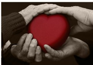
Somatisk helse hos pasienter med alvorlig psykisk lidelse

Rapporten peker på at somatisk sykdom ofte blir oversett hos personer med alvorlig psykisk lidelse. Den psykiske lidelsen kan overskygge symptomer på annen sykdom. Dette fører til både manglende akutt - og forebyggende helsehjelp. Somatisk oversykelighet og samtidig underbehandling hos pasienter med alvorlig psykisk lidelse, fører til mange tapte leveår.