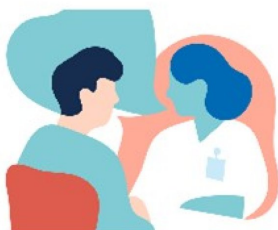
Erfaringer fra kollegastøtteordninger

Gjennom våre undersøkelser av alvorlige uønskede hendelser erfarer vi at helsepersonell uttrykker behov for mer systematisk ivaretagelse av den enkelte når noe går galt. Trygge ansatte og stabilitet i stillingene i helse- og omsorgstjenesten er viktig for pasientsikkerheten.