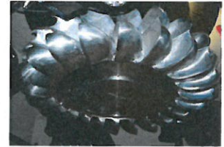
Innvik Kraftverk AS