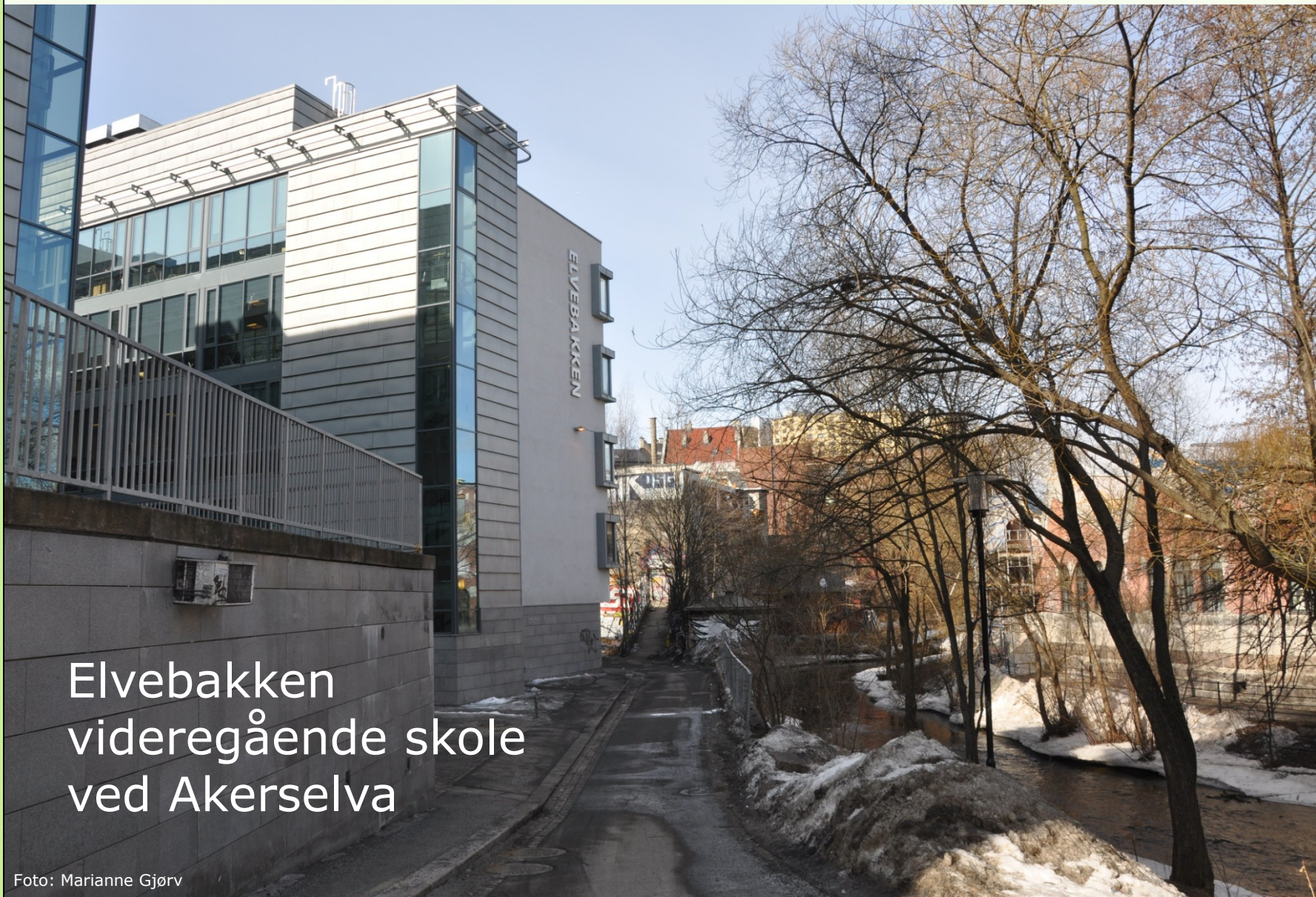
Elvebakken videregående skole ved Akerselva