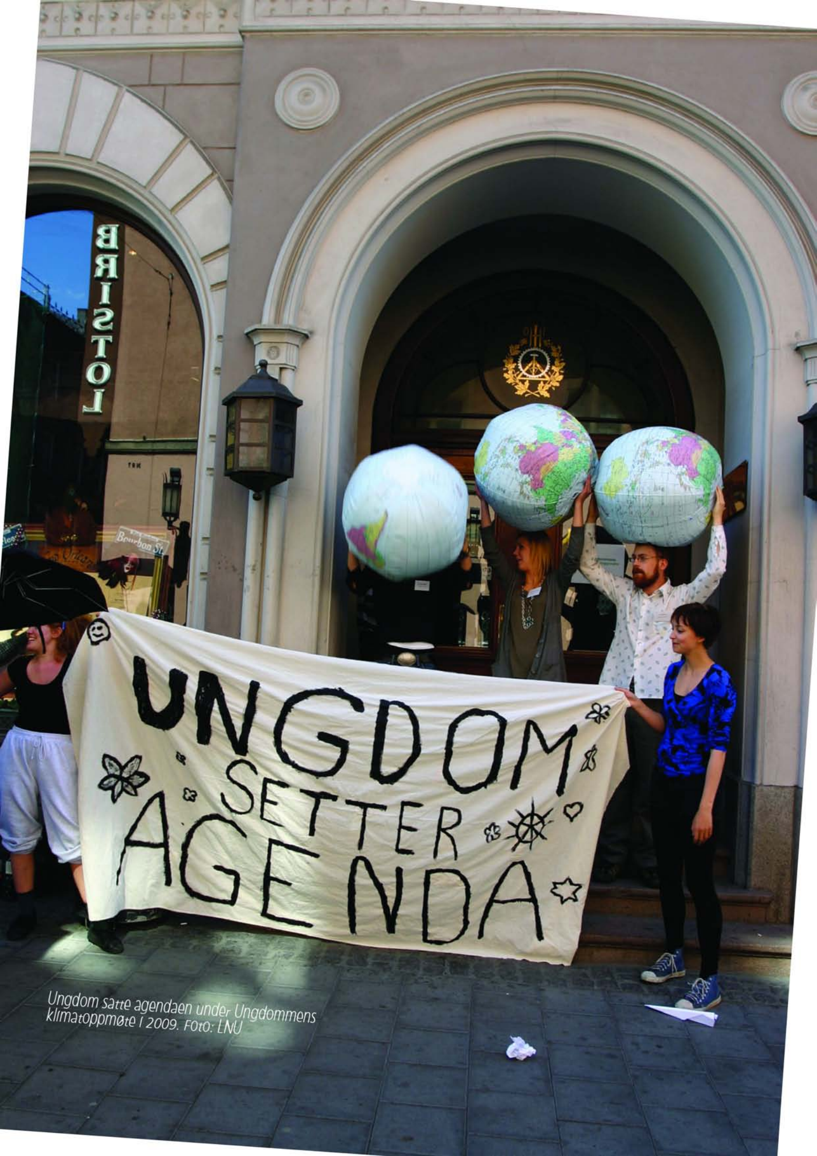
Ungdom satte agendaen under Ungdommens klimatoppmøte i 2009.