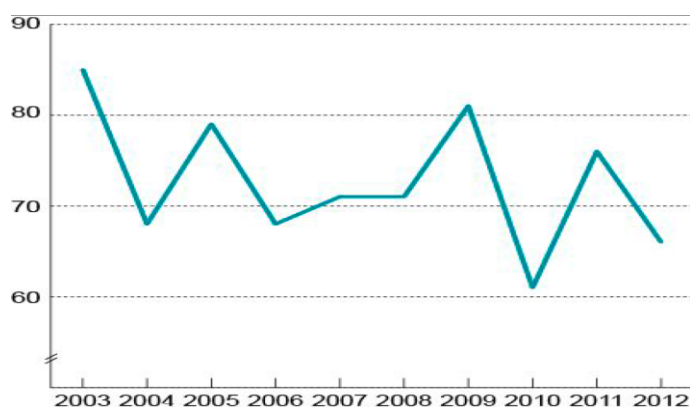
Figur 1.1 Lønns glidningen som andel av total lønnsvekst fra 1. oktober til 1. oktober for industriarbeidere i NHO-bedrifter

1 Gjennomsnittstallet er summen av alle nivåmessige tillegg gitt i de forbundsvise områdene inklusive generelle tillegg, lavlønns tillegg, fagarbeidert tillegg, ansiennitet tillegg, skift tillegg etc. De fleste forbundsvise tariff tilleggene ble gitt med ulike virkningstidspunkt mellom 1. april til 1. juli.