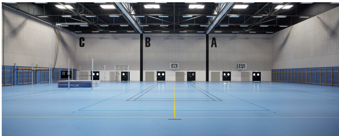
Idrettshallen har internasjonale mål og kan deles inn i tre haller.