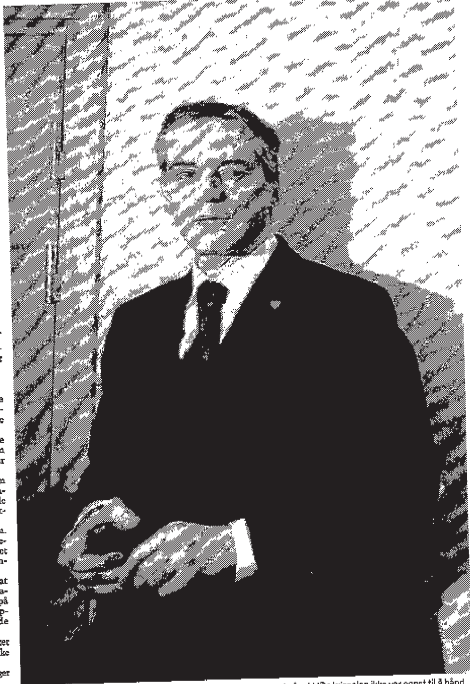
HARDT PRESSET: Utenriksminister Jonas Gahr Støre innrømmer i går at UD's kriseplan ikke var egnet til å hånd

spør Støre Dagbladets journalist om vi nå har fått oppklart situasjonen. Da sier han også: