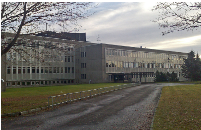
Adkomst mot hovedinngangen.

Kompleks 104 HØGSKOLEN I ØSTFOLD, SARPSBORG