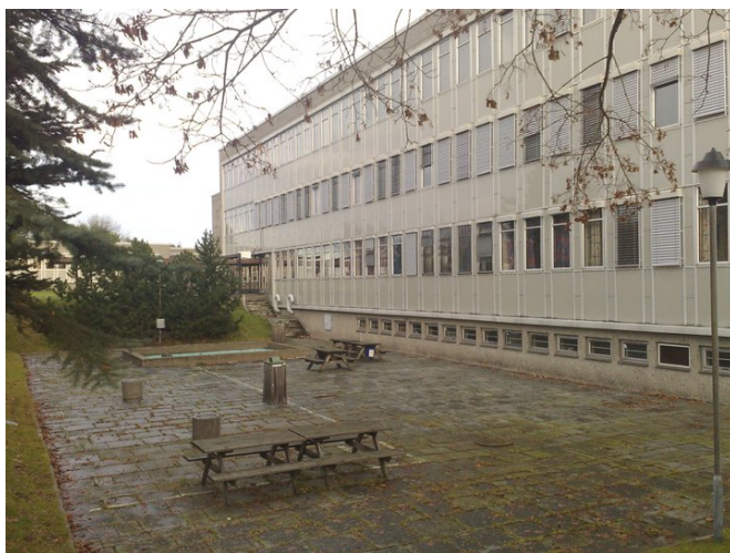
Fløy med hovedinngang og steinlagt areal med basseng.