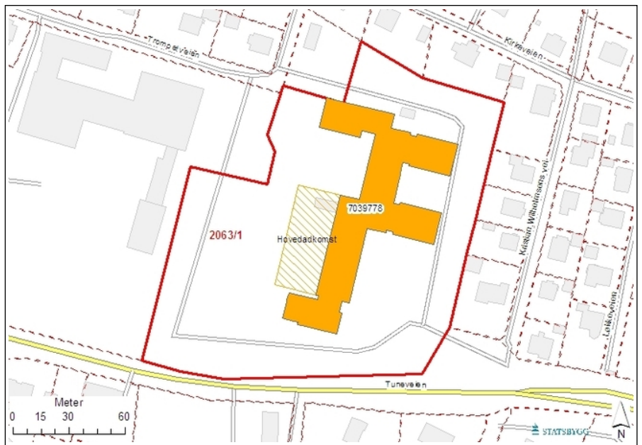
Situasjonskart. Opphavsrett: Statsbygg.