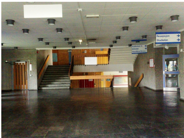
Hovedinngangens hall.