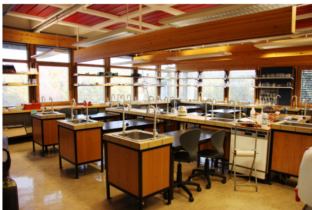
Opprinnelig fysikkrom.