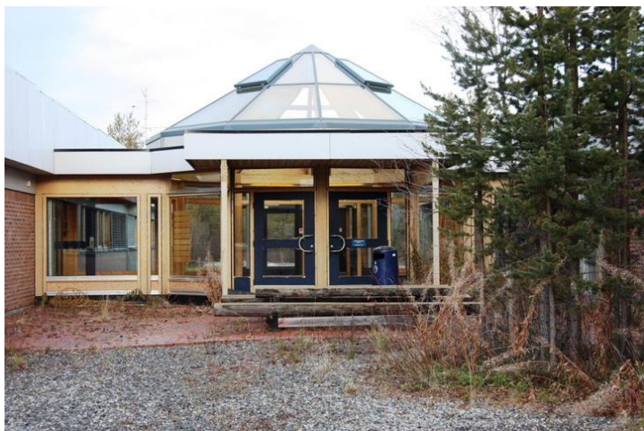
Bygg 2 1996.