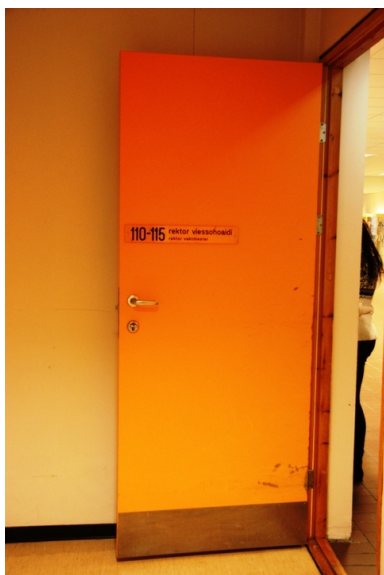
Originale dører.