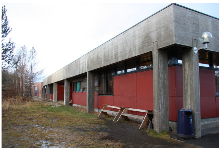
Bygg 1 1979