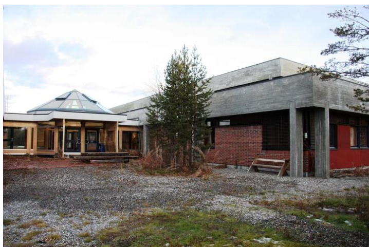
Bygg 1 1979