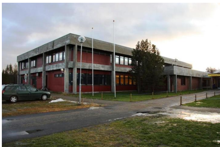
Bygg1 1979