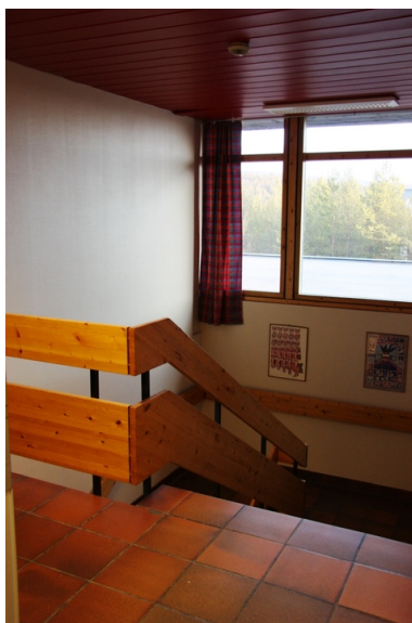
Opprinnelig trapperom.