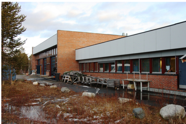
Bygg 2 1996.