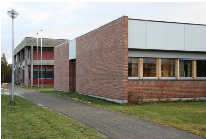
Karasjok vgs.