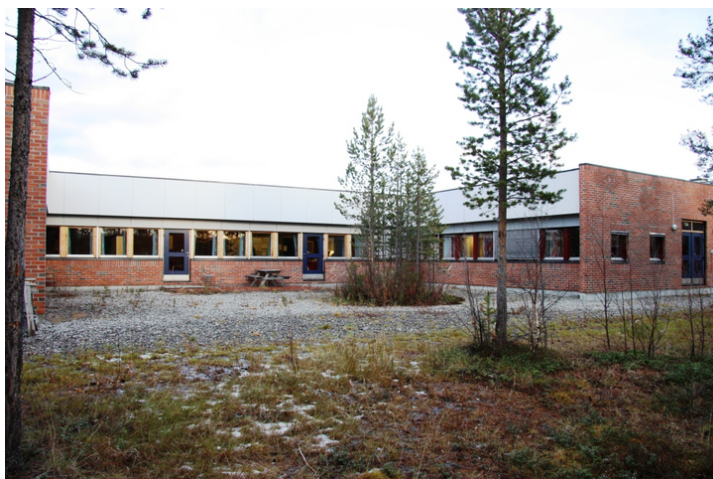
Bygg 2 1996. Opphavsrett: Statsbygg.