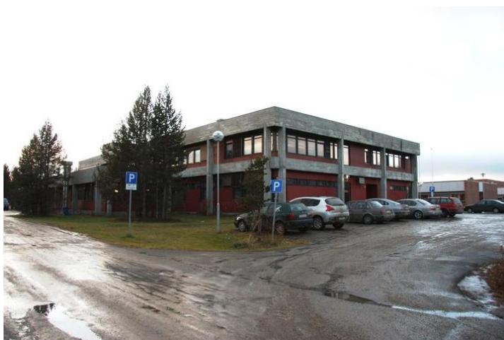
Bygg 1 1979