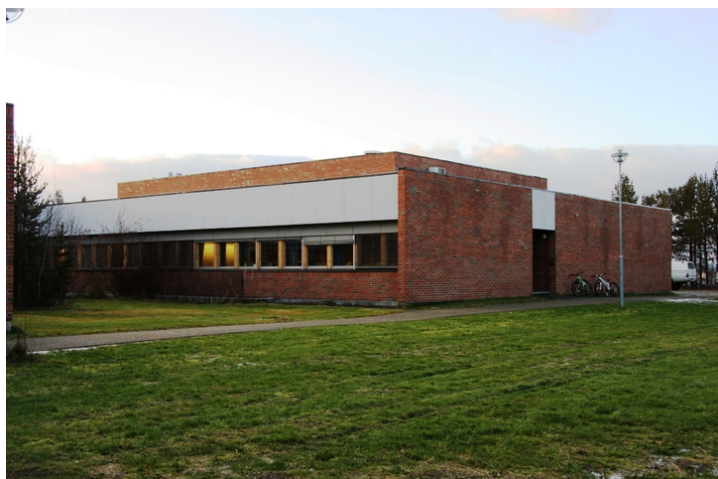
Bygg 2 1996