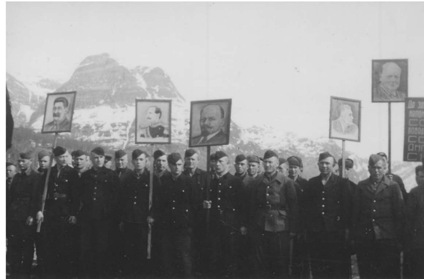
Sovjetiske krigsfanger i Bogen ved Narvik 1945. Советские военнопленные в Бугене под Нарвиком 1945 г.

Судьба вернувшихся домой советских военнопленных долгое время была предметом спекуляций. Западные авторы во многих случаях давали одностороннюю картину приема военнопленных советскими властями, фокусируя на расстрелах и на новом плену в штрафных лагерях. Из рассказов бывших военнопленных явствует, что их, как правило, по возвращении на родину подвергали основательной проверке. Современные исследования советского времени показывают, что более половины было отправлено прямо домой.