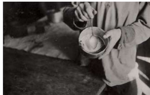
Side 12: Sovjetiske krigsfanger. Saltfjellet 1945.