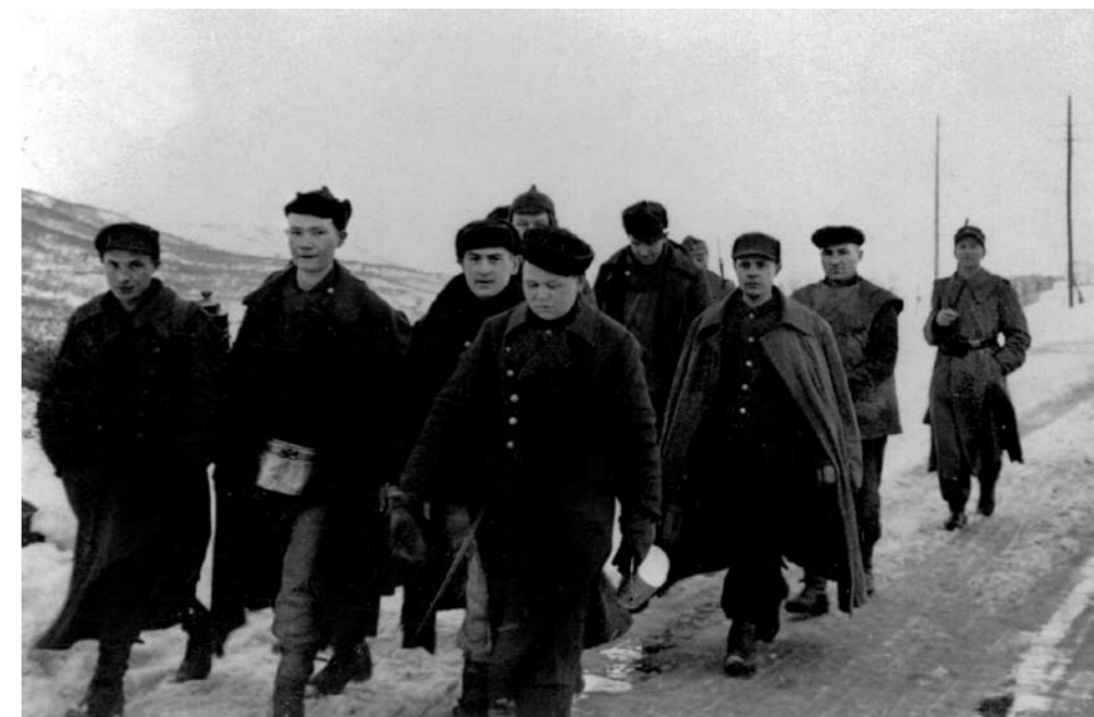
Sovjetiske krigsfanger i Oppdal underveis fra arbeid vinteren 1945. Советские военнопленные в Уппдале по дороге с работы зимой 1945 г.

Главкомандующий немецкими оккупационными силами в Норвегии, Фалкенхорст, требовал 145 000 военнопленных для осуществления планов Гитлера о строительстве железной дороги до Киркенеса. Эти планы не были реализованы. Но проект строительства железной дороги Нурландсбанен был частично осуществлен силами военнопленных.