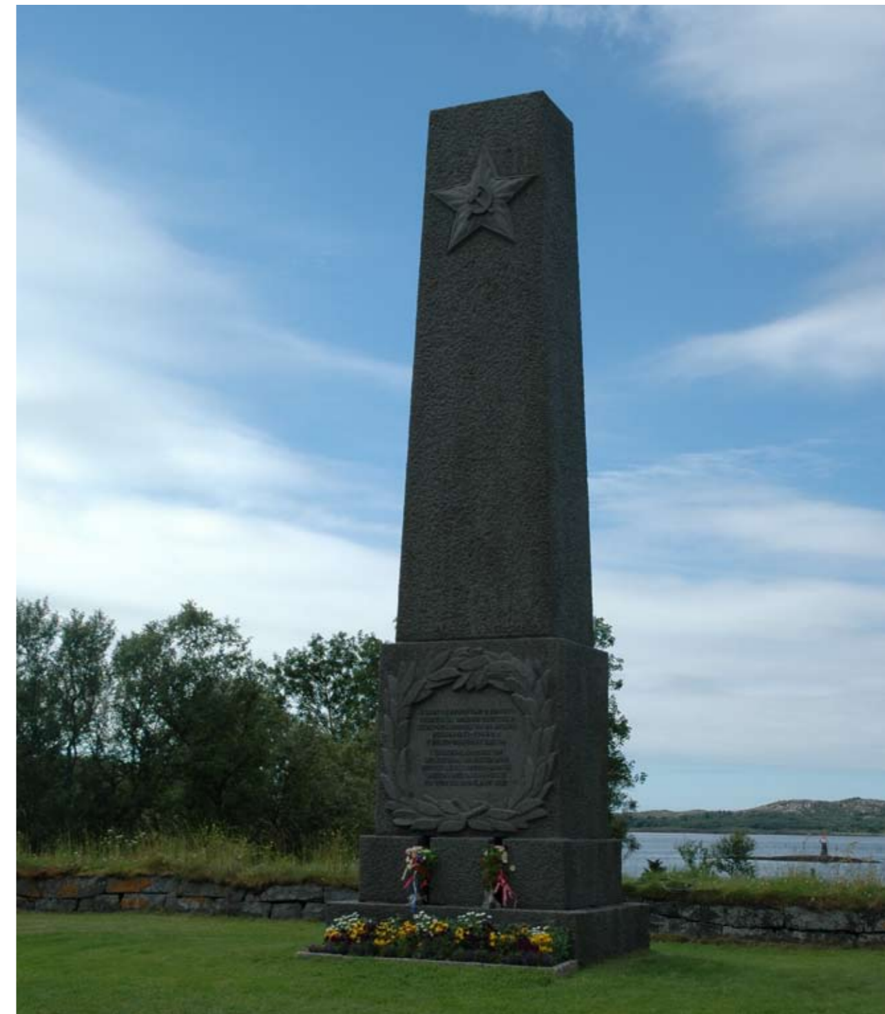
Side 29: Tjøtta krigskirkegård 2005. Страница 28: Военное кладбище Тъётта 1951 г. Страница 29: Военное кладбище Тъётта 2005 г.