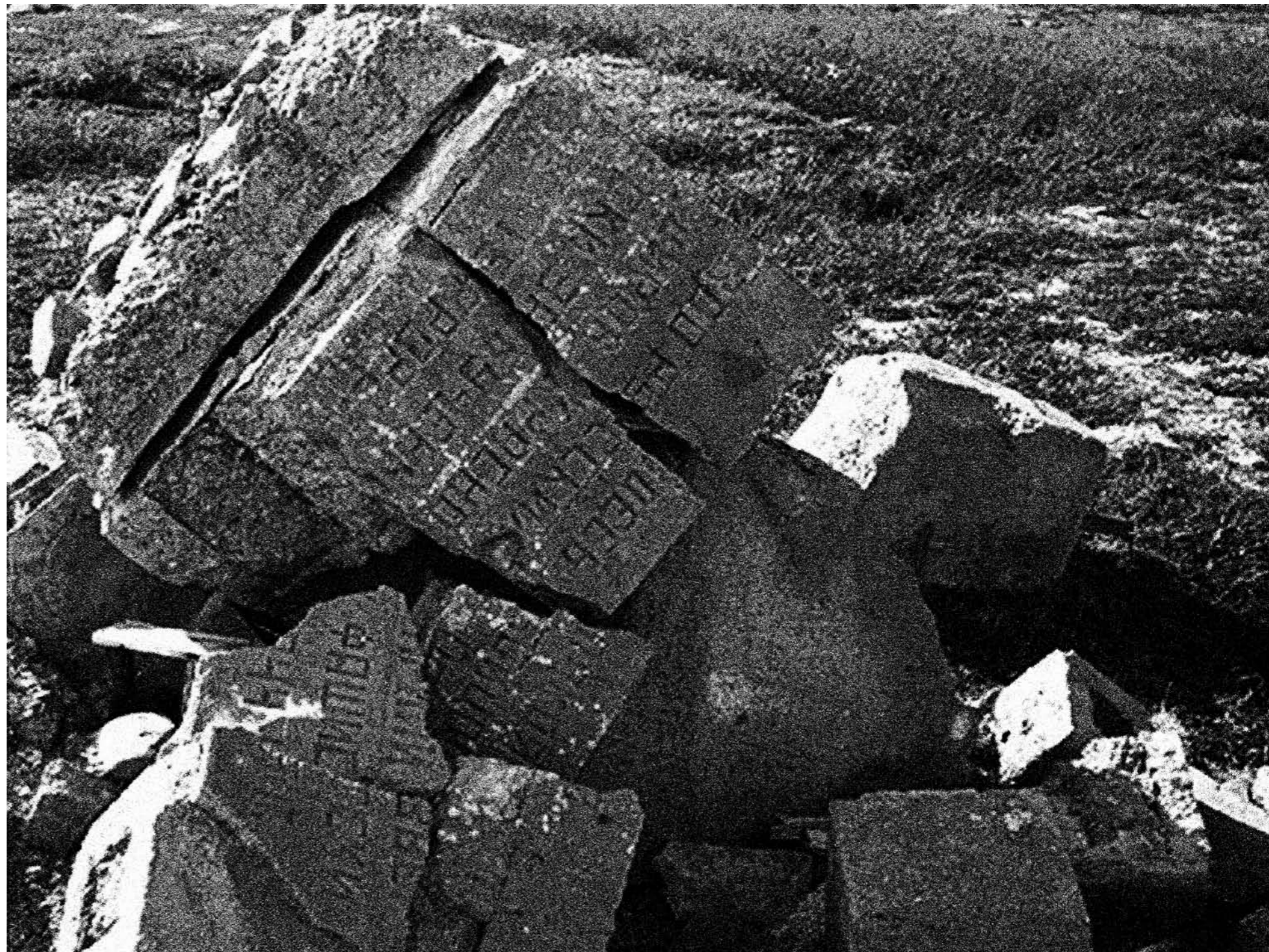
Страница 26: Могилы советских военнопленных. Салтфьеллет 1945 г. Владелец снимка: Гос. архив Норвегии. Страница 27: Разрушенный памятник в Салтфьеллет 2003 г. Владелец снимка: Харри Бьеркли.