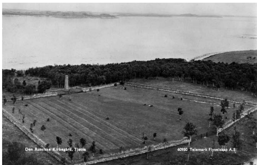
Side 28: Tjøtta krigskirkegård 1951.

Плиты с именами - важный элемент места памяти Тъётта. Они рассказывают о забытой истории на норвежской земле и дают ощущение уникальной близости к истории. Они также имеют большое значение для людей, разыскивающих информацию о родственниках, отдавших жизнь в немецком плену в Норвегии.