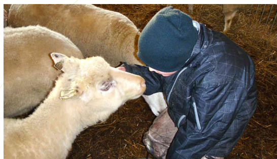
Dyr gir positive tilbakemeldinger uansett egen dagsform

Arbeidsoppgavene er lagt opp slik at den enkelte skal oppleve mestring og utvikling. Det er mange ulike oppgaver, og de varierer gjennom året og gårdsdriftens ulike faser. I det daglige ligger fôring og stell av sau, hest, hund og smådyr. Slåttarbeidet kommer på sommeren og mer vedlikehold av maskiner og bygninger på vinterstid. Det dyrkes også litt poteter og grønnsaker, og i utmarka pågår beiterydding og skjøtsel av kulturlandskapet.