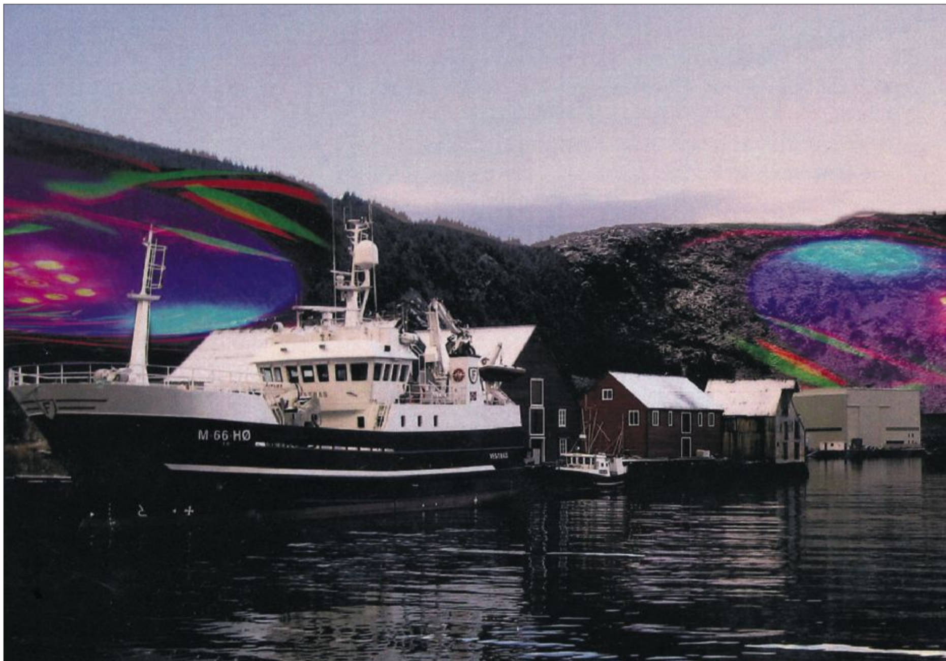
LYS. Forslag til opplyste fjellsider oppover mot Hornseten og Tverrfjellet over Fosnavåg hamn. Slikt kan danne grunnlag for eksempel for lysfestival, seier Dag Langve Sauge i tettstadprogrammet i Møre og Romsdal fylkeskommune

ALLE ILLUSTRASJONAR FRÅ BROSYRE OM LYSBY