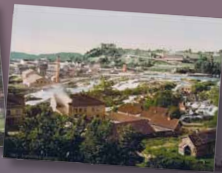
Hønefoss, ca. år 1900.

Temaet er allmenngyldig og vi har gode eksempler nasjonalt – og enda flere internasjonalt. Nøkkelbegrep er energipassiv boligbygging, kollektivtransport, tilrettelegging for gående og syklende, parkeringsrestriksjoner og nærhet til offentlige tilbud, søkelys på kultur i byen og ulike former for handel. Har en liten norsk by muligheter til å benytte seg av samme metodikk som vi kjenner fra mer kjente europeiske byer – hva må til?