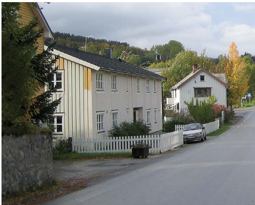
I Brugata bygges det sentrumsnære leiligheter

Men for å bli en attraktiv bokommune gjenstår det fortsatt noen utfordringer, blant annet i forhold til å lykkes med boligpolitikken. Selv om det er etablert nye småleiligheter, sitter investorene fortsatt på gjerdet og avventer utviklingen. Det gamle sykehjemmet står ubebodd og gir uheldige signaler om utviklingen på stedet. Og flere utenbys grunneiere er lite interessert i å leie ut boligene sine som står tomme. Men Tolga jobber bevisst med å øke bosettingen og tilbudet på tilgjengelige og attraktive boliger. Etter en svensk modell sendte Tolga høsten 2005 ut en invitasjon til alle foreldre i Oslo med barn i 1. ste klasse, om