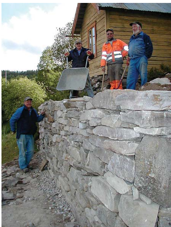
Tørrmuringkurs holder gammelt håndverk i hevd

Riksantikvaren har vært sentral i arbeidet med opprusting av området rundt Hytteelva. Staten har foretatt flere befaringer i området, deltatt på møter og bevilget til sammen 140.000 kroner til planarbeid og opprusting av murene. Det har vært krevende å ta vare på den gamle steinhvelvsbrua med dens tilliggende natursteinsmurer, samtidig som man rustet opp betongmurene og anla nye plasser med et mer moderne uttrykk. Men med god støtte fra Rørosmuseet og Riksantikvaren har resultatet blitt meget vellykket.