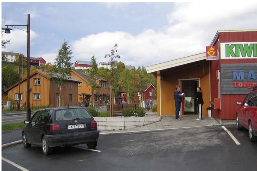
Langs RV 30 er forretningslokalene igjen fylt opp, til glede for bygdas befolkning.

Gjennom tettstedsprosjektet endret gradvis kommunen sine holdninger og arbeidsmetoder overfor næringslivet og de private. Blant annet prøvde man nå aktivt å trekke næringslivet med i planleggingen. Det er fortsatt en lei tradisjon mange steder at planleggerne bare jobber på planleggingssiden og næringslivet bare på gjennomføringssiden. I Tolga ønsket man å binde de to bedre sammen. Kombinasjonen av tettere samarbeid, større påvirkningsevne og positive resultater for bygda har sakte men sikkert ført til en holdningsendring hos næringslivet og de private grunneierne. Noen bedrifter har også etter hvert lagt litt penger i eiendommer og bygninger. I dag har kommunen og næringslivet en større erkjennelse av at man er avhengige av hverandre for å utvikle Tolga til et attraktivt bosted og skape nye arbeidsplasser. Det er også gjennomgående en positiv holdning til tettstedsprosjektet og samarbeidsånden er mye bedre. I 2004 ble det reetablert en lokal handelsstandsforening som ønsker å samarbeide med kommunen.