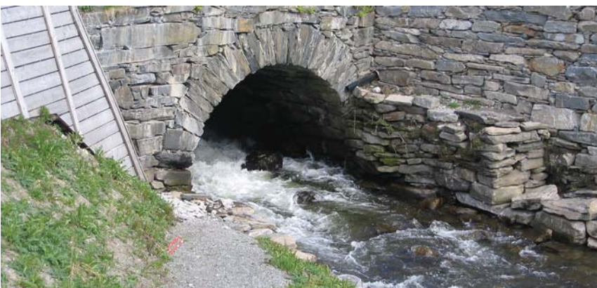
Den gamle steinhvelvsbrua er så god som ny igjen

Et av hovedmålene med Tettstedsprosjektet har vært å ruste opp og få en mer bevisst holdning til Tolgen Hytteplass - Tolgas tusenårssted, som