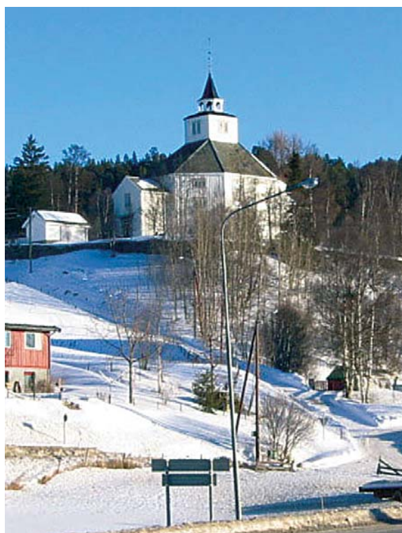
Den vakre kirken fra 1840 troner på toppen av Bakkagata