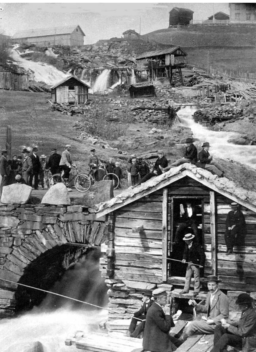
Liv og røre ved Hytteelva i 1890

innen Rørosverket. Rundt smeltehytta vokste det opp en tett bebyggelse av små gårdsbruk som tilhørte arbeiderne ved Verket. I 1731 bodde det ved smeltehytta 418 mennesker – 128 menn, 144 kvinner og 146 barn, - et betydelig samfunn etter datidens forhold. Smeltehytta var i drift i drøyt 200 år, fra 1666 - 1871.