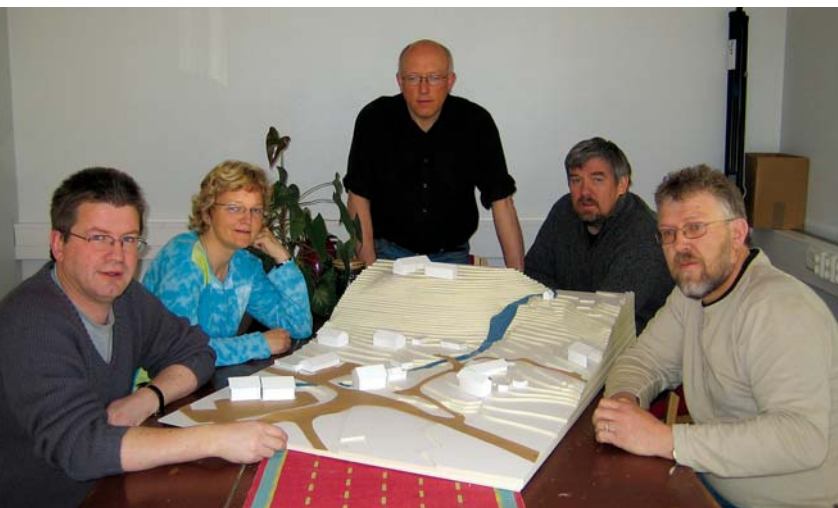
Prosjektgruppa hadde faste tirsdagsmøter gjennom hele prosjektperioden

I Tolga har både ordfører og rådmann vært personlig engasjert i utviklingen av stedet. Samarbeidet dem imellom har vært nært og konstruktivt og bidratt til effektive prosesser mellom besluttsende og utøvende myndighet - mellom politisk nivå og administrasjon. Tettstedsarbeidet har også hatt en god tverrpolitisk forankring fra start til slutt, og full politisk oppslutning og støtte gjennom hele perioden. Felles enighet om mål og virkemidler gjør det mye lettere å gjennomføre tiltak. I tillegg blir arbeidet mindre påvirket av politiske skifter.