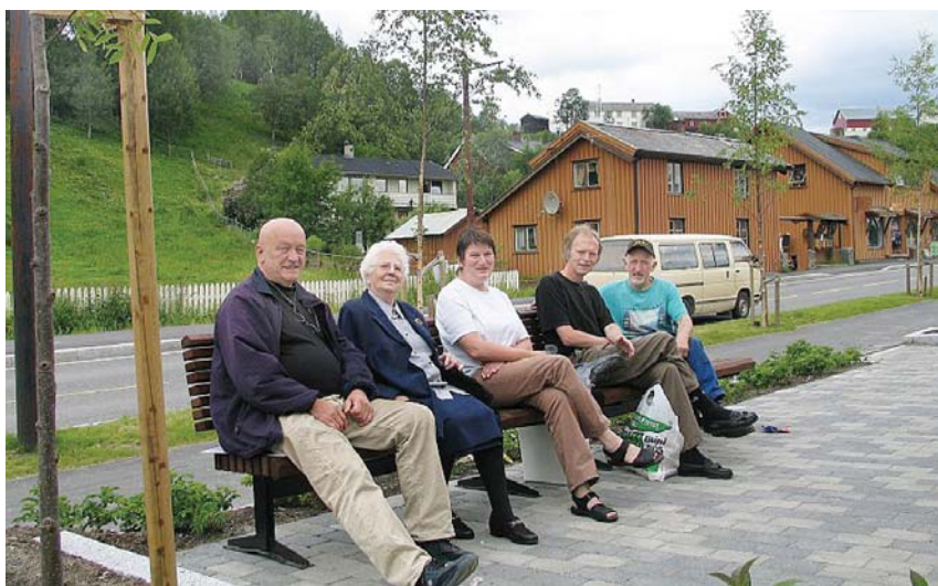
Tolgabanken er en av mange uformelle møteplasser i bygda

"Tettstedsutvikling handler om å skape møteplasser mellom mennesker." (Marit Gilleberg, ordfører)