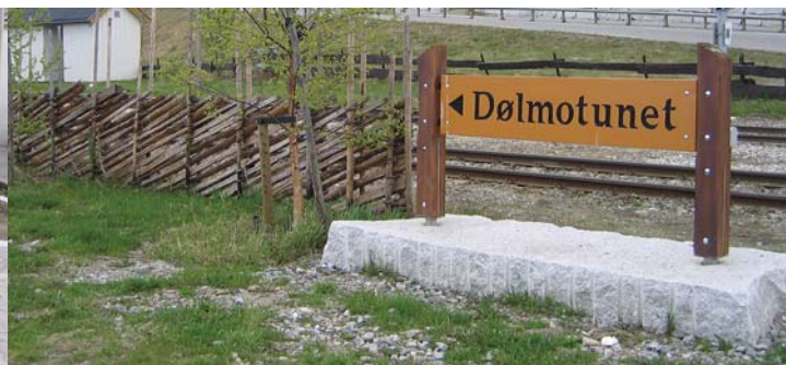
Visuell veileder inneholder egne forslag til utforming av skilt og gatemøbler i Tolga sentrum. Produktene lages av lokale håndverkere i lokale materialer som Tolgagranitt og tre

”Med visuell veileder setter vi fokus på våre omgivelser, og hvordan vi ønsker at de skal formes og utvikles” (Stine Ringnes, prosjektleder)