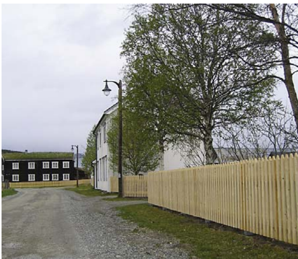
Nye stakittgjerder klare for egenprodusert maling