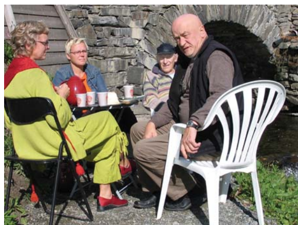
Ordføreren inviterer til kaffe og kake på den nye plassen ved Hytteelva. Det er viktig å feire små og store begivenheter.

Dugnadsånden har lenge vært god i Tolga, et fortrinn kommunen ønsket å bygge videre på gjennom Tettstedsprosjektet. Mobilisering av tolgingene har derfor vært viktige grunnpilarer i arbeidet - fra idéfase til gjennomføring. Kommunen har vært meget bevisst på behovet for å informere folk i bygda om planer og prosjekter, og trekke dem med på råd der det har vært hensiktsmessig. Det er gjennomført folkemøter og temamøter knyttet til mer avgrensede problemstillinger og prosjekter. Ungdommen deltok også aktivt i arbeidet gjennom barne- og ungdomsskolen. Blant annet deltok alle elever mellom 11 og 16 år i et prosjekt der målet var å komme med innspill til kommuneplanen angående barn og unges oppvekstmiljø.