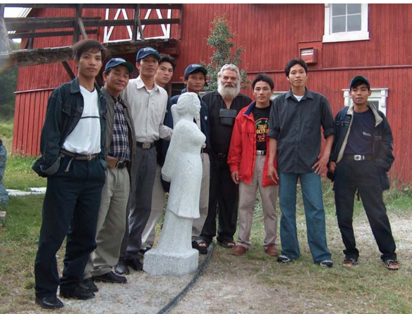
Basert på Tolgas egen granittressurs er det bygget en steinbro mellom Tolga og Da Nang i Vietnam

dam og bruer. Her ønsket Storbækken å anlegge en skulpturpark. Bakgrunnen for det internasjonale samarbeidet var at billedhuggeren driver et opplæringsssenter for steinhuggere i Vietnam. Sommeren 2004 tok han med seg syv lærlinger, en billedhugger og en tolk og reiste til Tolga for å hugge i granitt fra det lokale steinbruddet, Olaberget. Arbeidet foregikk på Johnsgård, et tun midt i Tolga sentrum - ikke langt fra Malmplassen. Aktiviteten kunne følges av interesserte tolginger og tilreisende i hele perioden.