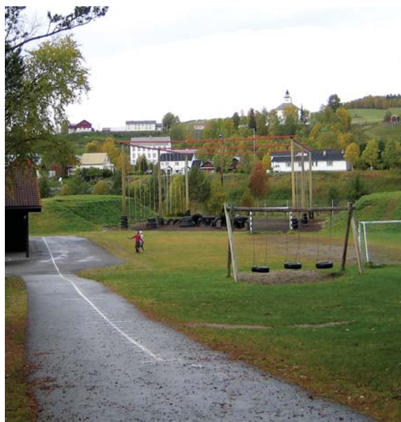
Uteområder ved skolen skal rustes opp på nytt sammen med barna

Undersøkelsen viste også at elevene er godt fornøyde med skolen sin, noe som betyr mye for bolysten til barnefamilier. Faglig sett kan det vises til gode resultater og utvikling, og skolen ligger langt framme på en del områder. Ledelsen