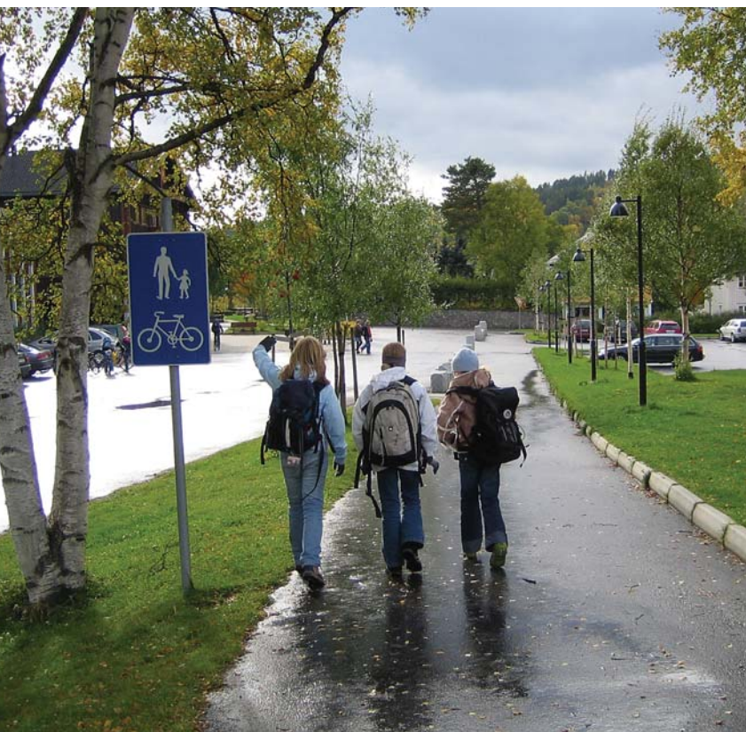
Nye gang- og sykkelveier gjør det tryggere å ferdes på Tolga.

Gjennom Tettstedsprosjektet har Tolga tatt et langt steg videre med hensyn til å bli et attraktivt bosted. Sentrum har blitt renovert og forskjønnet og det er skapt nye møteplasser. Centralparken er under opprusting i samarbeid med ungdommene på stedet. Den lokale natur- og kulturarven er styrket som grunnlag for tilhørighet, stolthet, opplevelse og ny næringsvirksomhet. Og Skulpturparken kan bli et framtidig turistmål. Nye gang- og sykkelveier har gjort det enklere og tryggere å ferdes. Bygda har også et stort tilbud innen kultur- og fritidsaktiviteter, blant annet har de et stort årlig Olsok-program for hele regionen.