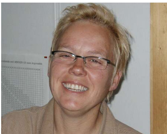
Ordfører med tæl!

Tolga har gjennom kommuneplanen (2003-2013) og i andre sammenhenger valgt å markedsføre seg som en "kommune med tæl". Med det ønsker de å fortelle omverdenen at tolgingene har en ekstra sterk dugnadsånd og et stort lokalt engasjement for fellesskapet. I tillegg er det mange aktiviteter på gang – et aktivt samfunn. Mye av "tælen" springer ut av kultur og en oppriktig glede over å stå sammen om å få til ting, men det er også en overlevelsesstrategi: - Vi må berre gjer det! Ikke alle på stedet har alltid vært like enig i slagordet heller: