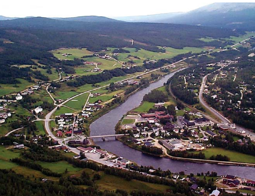
Tolga sett nordover, sentrum øst på høyre side av Glåma