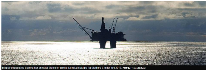
Miljødirektoratet og Bellona har anmeldt Statoil for ulovlig kjemikalieutslipp fra Stafford B-feltet juni 2013.