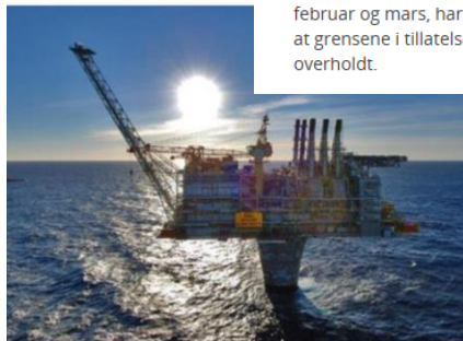
Utslipet av smøreolje fra Draugen har blitt anmeldt.