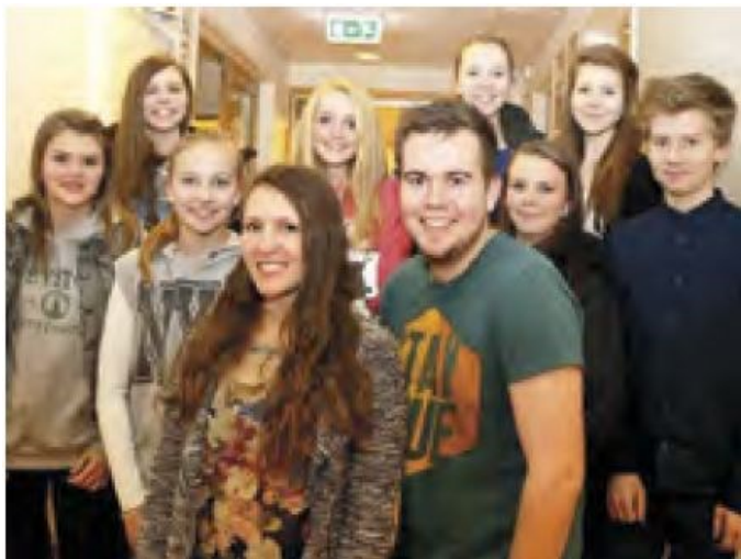
Ungdomsrådet i Radøy kommune

Radøy kommune i Hordaland utnevnt til Årets barne- og ungdomskommune for sitt brennende engasjement for barn og unge. Gode og trygge oppvekstvilkår og like muligheter til å utvikle seg slik de ønsker kjenner tegner kommunens mål for barne- og ungdomspolitikken.