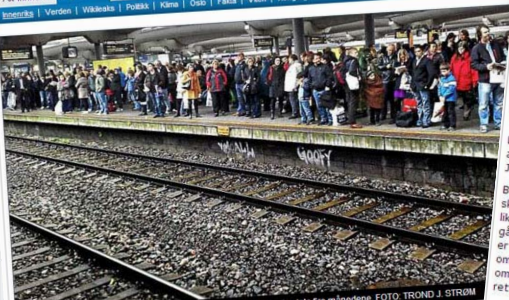
Endeløs venting på forsinkede tog har vært hverdagen for mange de siste fire månedene.

Alt innhold | Nyheter | Sport | Meninger | Økonomi | Kultur | Oslopuls | Arkivet | Reise | Mat og vin | Jobb Innenriks | Verden | Wåkeaks | Politikk | Klima | Oslo | Fakta | Vitenskap | Kongelige | Helse | Leve | Siste 100