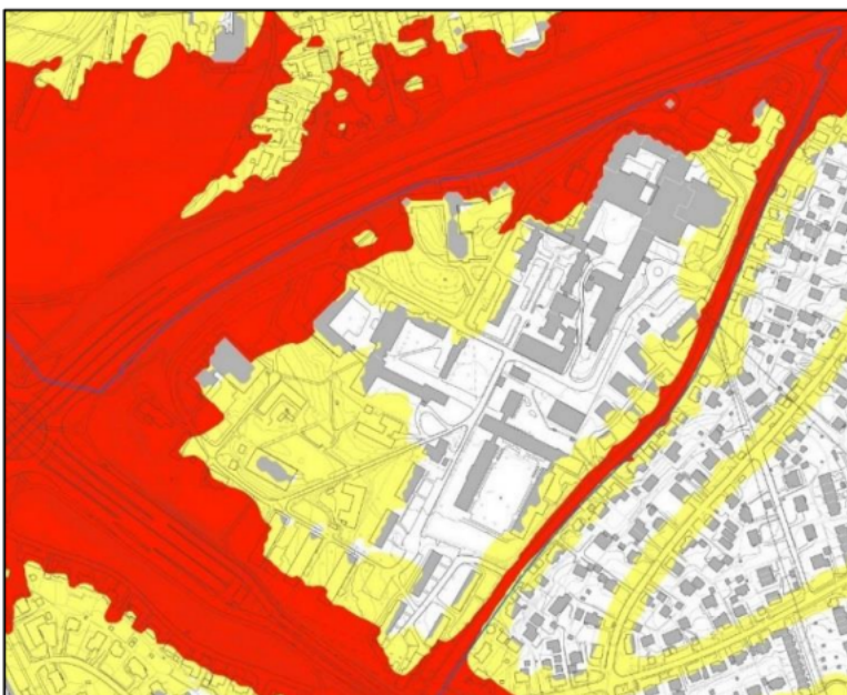
Støykart over planområdet med gul, rød og hvit sone.