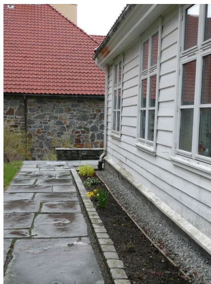
Fornytt fasade, nye vinduer.