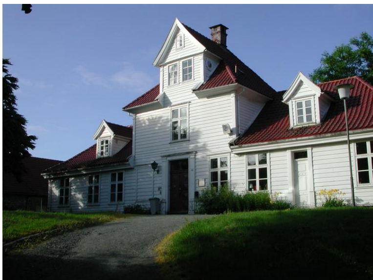
Fastings Minde, fasade mot øst.