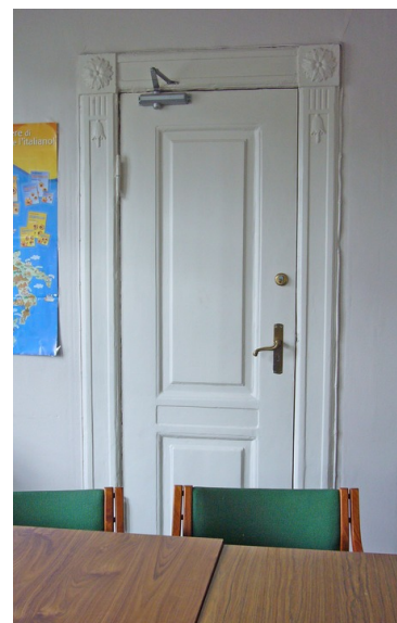
Dør med belistning.