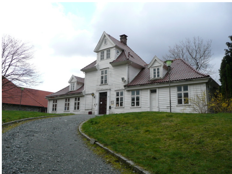
Fastings Minde.