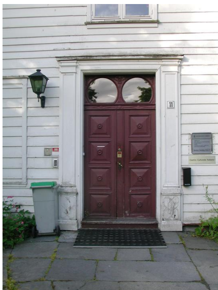
Fastings Minde, hovedinngang.