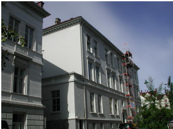
Rosenbergsgaten 35, fasade mot øst.