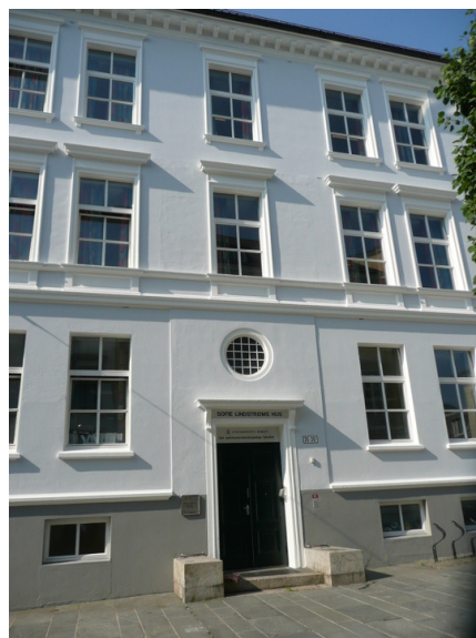
Utsnitt av fasade med hovedinngang.