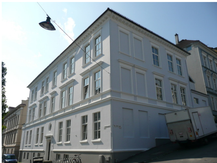
Sofie Lindstrømshus.