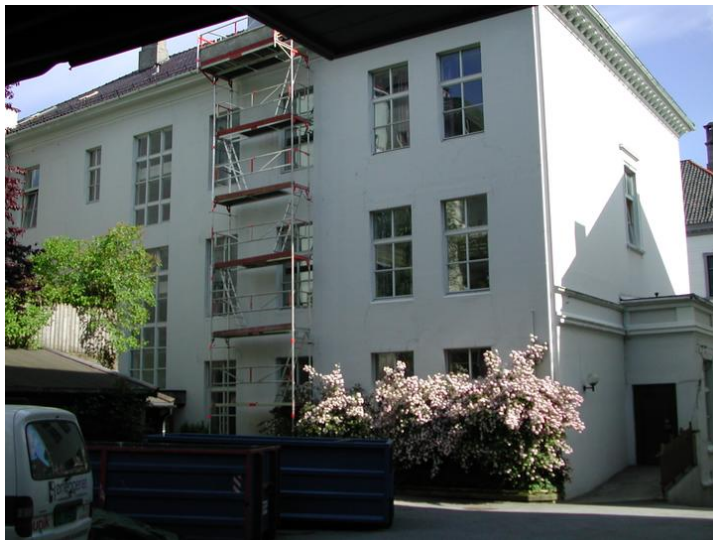
Rosenbergsgaten 35. Fasade mot sør, inn mot bakgård Opphavsrett: Statsbygg.