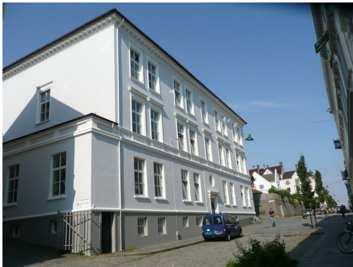
Sofie Lindstrøms hus.