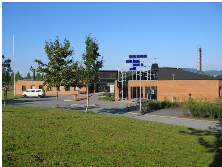
Skolebygningen på Heimdal fra 1991.