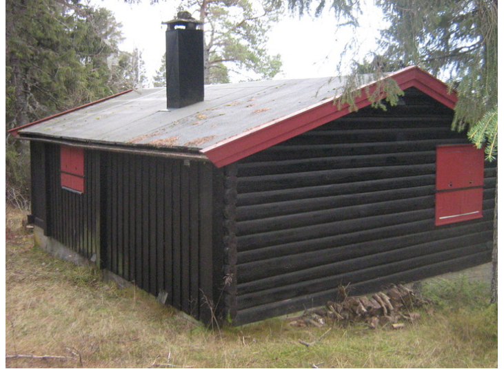
Hytta sett fra nordvest.