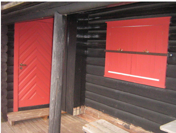
Inngang fra syd. Opphavsrett: Statsbygg.