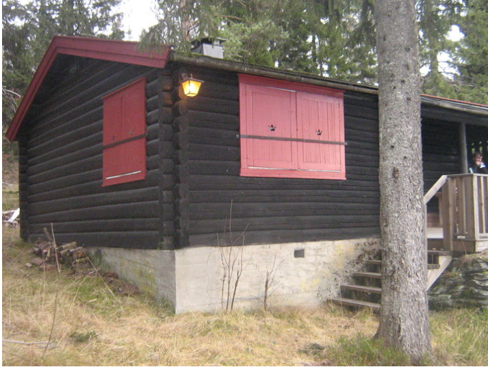
Hytta står på støpt grunnmur.

Kompleks 477 A. C. MØLLER SKOLE, HEIMDAL