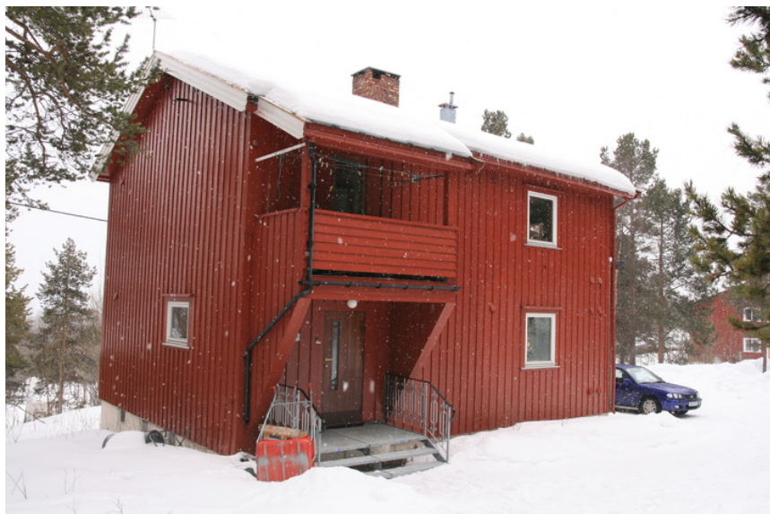
Nøkkelstien 9 A og B.