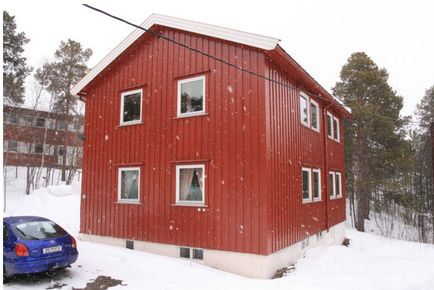
Nøkkelstien 9 A og B.

Kompleks 951 Høgskolen i Finnmark, Nøkkelstien 9