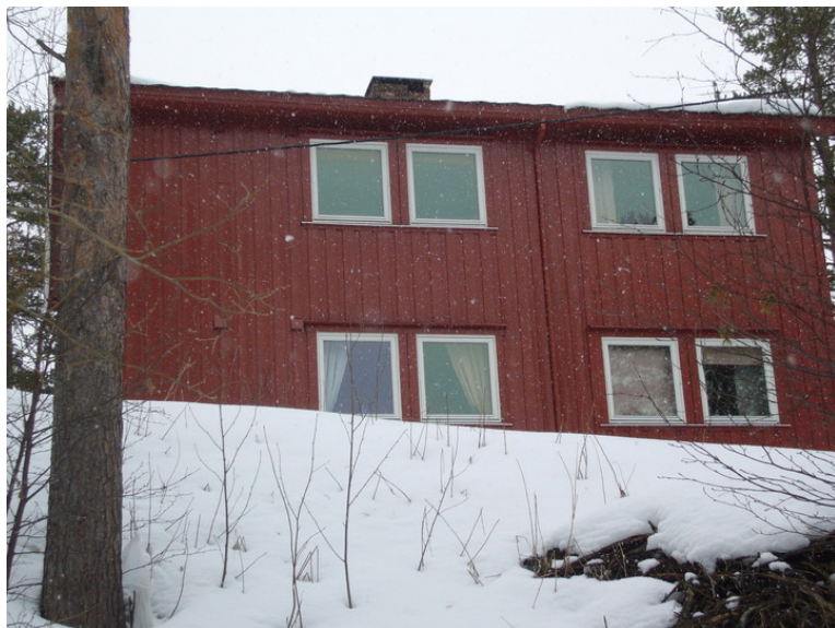
Nøkkelstien 9 A og B.