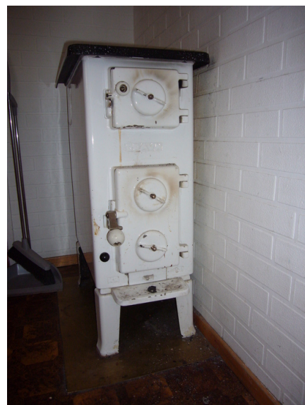
Opprinnelig var det ovnsfyring.