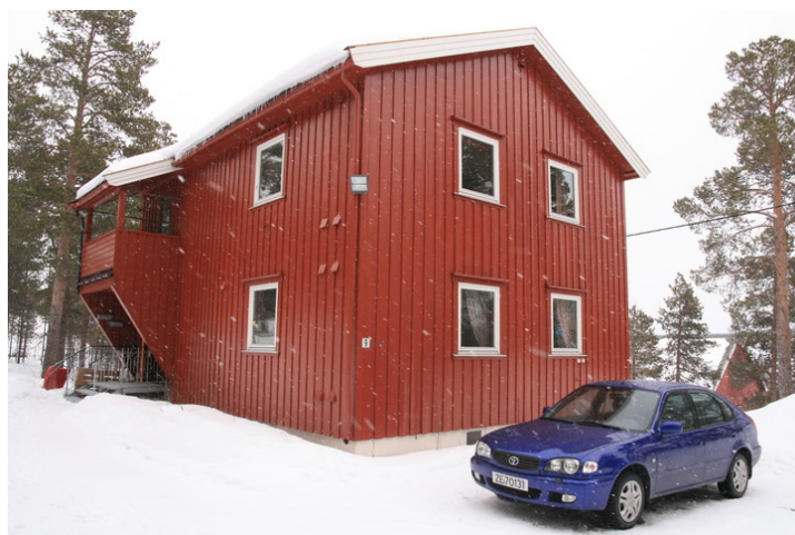
Nøkkelstien 9 A og B.