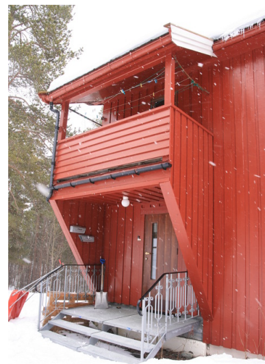
Overbygget inngangsparti. Nyere lettmetallstrapp og rekkverk.