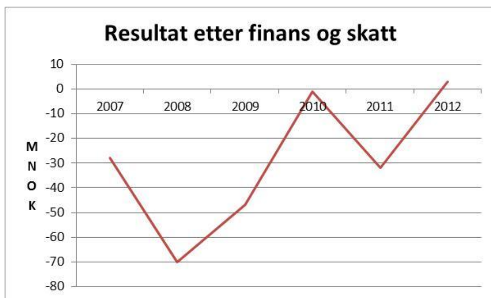
Figur 2: Resultat Norway Seafoods etter finans- og skattekostnader, selskapets norske virksomhet.

Norway Seafoods har over tid ikke oppnådd lønnsomhet. Selskapet har selv med kontinuerlig fokus på forbedrende tiltak ikke klart å oppnå overskudd på driften. Figur 2 viser driftsresultatet etter finans- og skattekostnader for perioden 2007 til 2012 for Norway Seafoods sin norske virksomhet. Det samlede underskuddet er på langt over 100 millioner kroner. Nofima har beregnet at den norske filetindustrien har tapt 650 millioner kroner i perioden 2000 - 2010. Uten overskudd på driften har også en satsing på foredlingsvirksomheten i nord uteblitt. Tusenvis av arbeidsplasser har blitt borte.