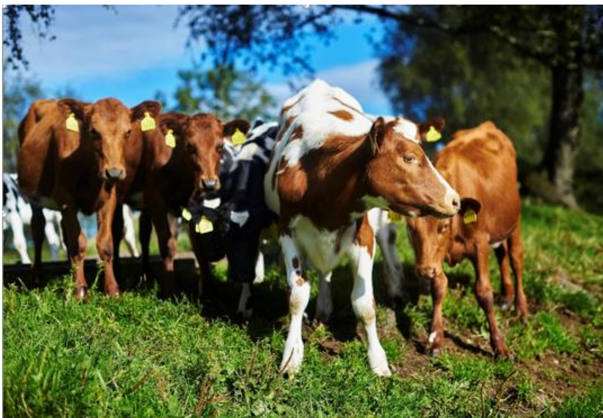
Et godt samarbeid mellom Mattilsynet og politiet vil bidra til å forebygge kriminalitet mot dyr og gi bedre dyrevelferd.