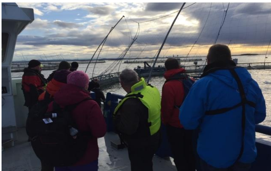
Mattilsynet holdt kurs for politiet om fiskevelferd og oppdrett. Deltakere fra politiet fikk en omvisning på matfiskanlegg og slakteri.

På den første dagen fikk deltakerne en omvisning på matfiskanlegg og slakteri med informasjon fra næringsaktører. Den andre dagen ble det holdt foredrag innen fag og regelverk av representanter fra Mattilsynet, Fiskeridirektoratet og Økokrim.