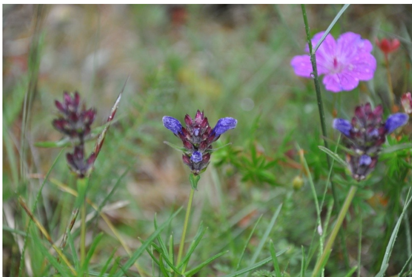
Dragehode trives i lyse og kalkrike områder.

For det andre; vår norske dragehodeblomst vokter i tillegg over en annen art – enda mer sjelden enn den selv. Denne "hemmeligheten" ble først avslørt i 1926. Da ble den lille dragehodeglansbille funnet på Snarøya i Oslofjorden. Dette svært spesialiserte insektet legger egg i blomsterknoppene til dragehode og lever bare der. Dragehodeglansbille er i tillegg med sikkerhet bare funnet i Norge, og ingen andre steder i verden. Slike arter har vi svært få av. Vår sjeldne lille bille bærer da også det latinske navnet Meligethes norvegicus , et navn den først fikk i 1959, og hvor tilnavnet norvegicus viser at arten ble beskrevet på funn fra Norge.