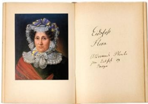
Rød skogfrue omtales i Madame Cappelens flora fra 1815.