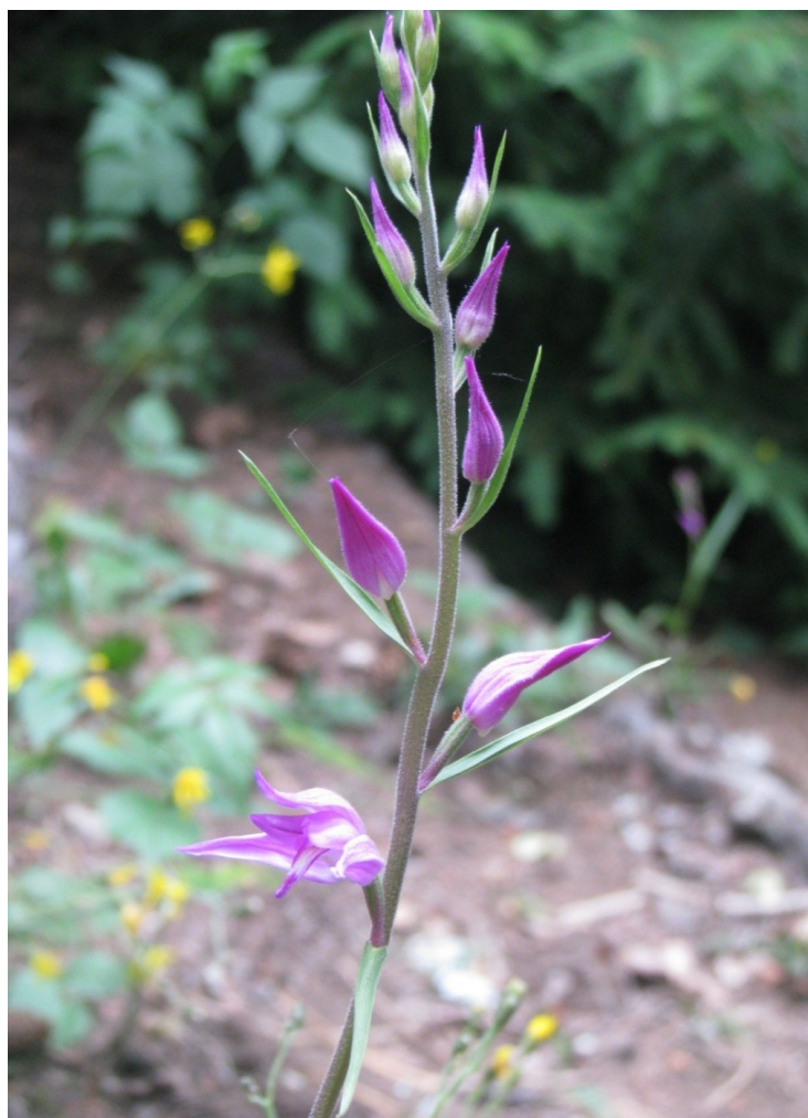
Denne røde skogfrua har fått navn og kalles "Dronningen".

Hun har i tillegg "valgt" å trives i kalkfuruskog, en skogtype som i seg selv er truet i Norge. Hun trives best i halvskygge, og følgelig er både gjengroing og skogbruk potensielle trusler for arten. Ja, selv det vakre utseende kan være en trussel for skogfrua, fordi planten blir utsatt for plukking og oppgraving.