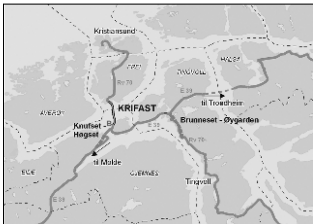
Figur 1.1 Kartskisse med oversikt over begge prosjektene og bomstasjonen

Samferdsdeparterementet fremmer i denne proposisjonen forslag om utbygging og finansiering av prosjektene Knutset – Høgset på E39 i Gjemnes kommune og Brunneset – Øygarden på rv 70 i Tingvoll kommune i Møre og Romsdal. Prosjektene er i hovedsak forutsatt finansiert med bompenger gjennom en utvidelse av eksisterende innkrevingsordning for Kristiansund og Freis fastlandsforbindelse (Krifast). I tillegg er det lagt til grunn 30 mill. kr i statsmidler i perioden 2010–2013.