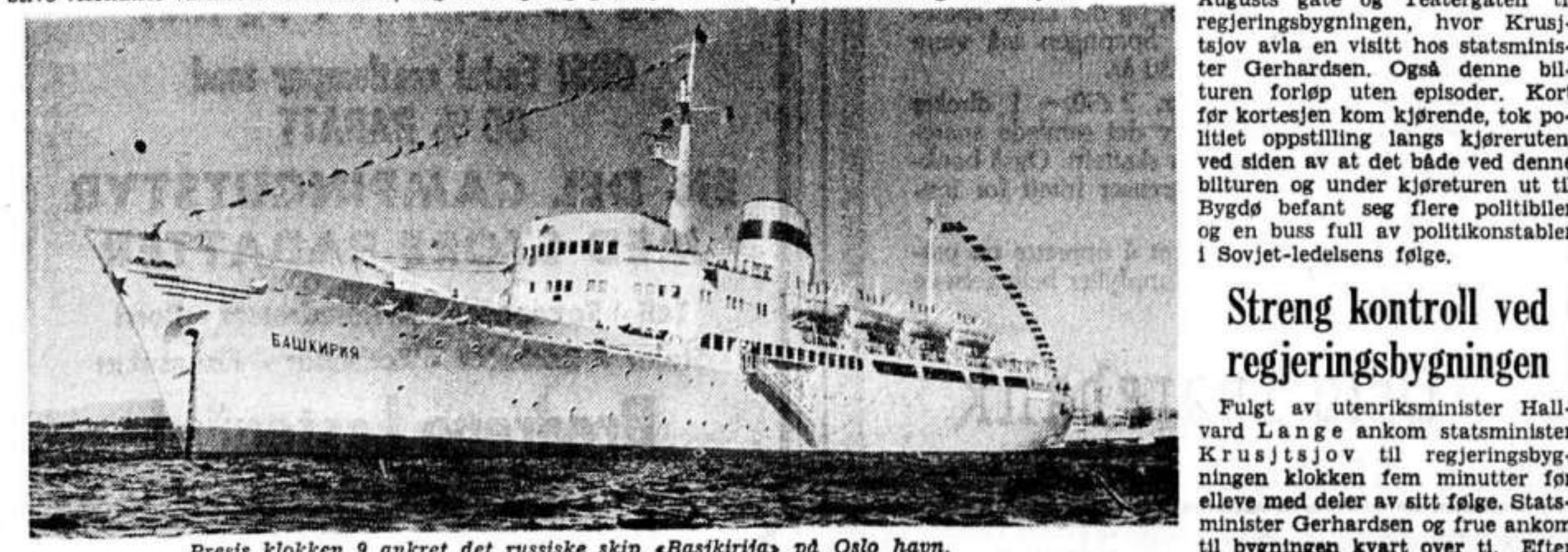
Presis klokken 9 ankrer det russiske skip «Basjkirija» på Oslo havn.

Atomalderen forutsetter en verden hvor ingen klasse, rase eller nasjon utbytter en annen — en verden hvor mennesket fritt kan følge Guds vilje og sin ærlige overbevisning. Denne verden av imorgen mobiliserer mennesket av idag i en total betredelse renset for hat, bitterhet skadedyr, maktybrnde. I lys av denne målsetting som omfatter alle mennesker, ønsker vi Dem velkommen til Norge.