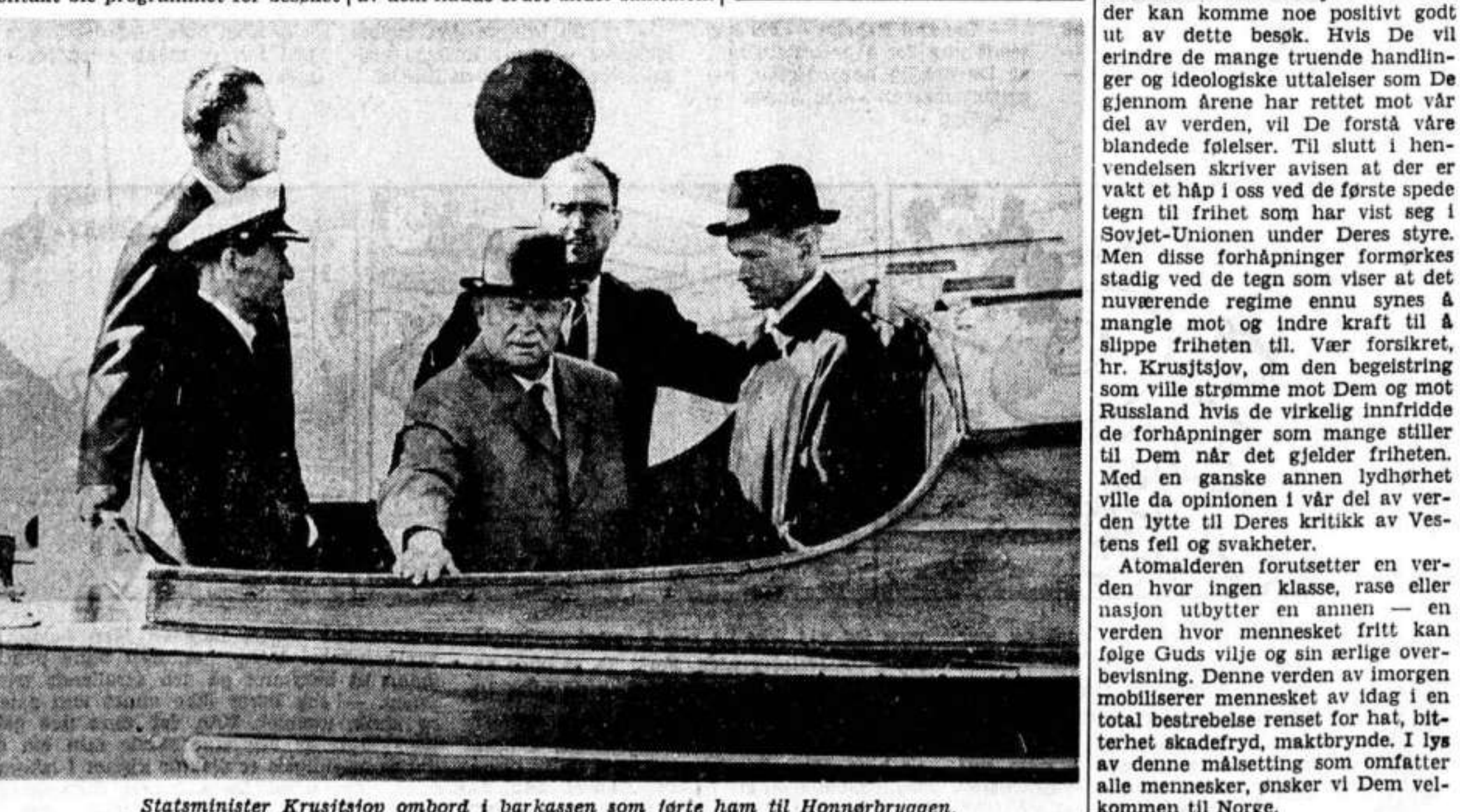
Statsminister Krusjtsjov ombord i barkassen som førte ham til Honnørbruggen.