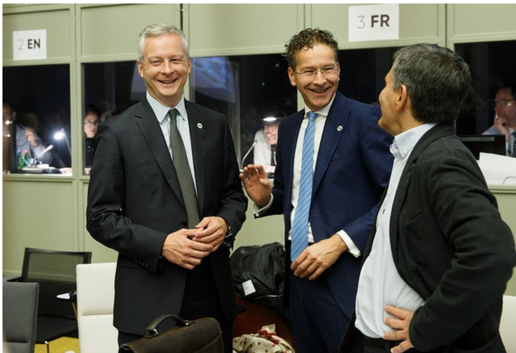
Finansminister Le Maire (Frankrike), finansminister Dijsselbloem (Nederland) og finansminister Tsakalotos (Hellas)

På den annen side vurderte Eurogruppen det som positivt at Kommisjonen 12. juli hadde anbefalt å oppheve underskuddprosedyren mot Hellas. Dette skjedde etter at statsregnskapet for 2016 viste et overskudd på 0,7 pst. av BNP (etter et underskudd på 6 pst. året før). Eurogruppens formann Dijsselbloem opplyste på pressekonferansen etter møtet at Rådet ville vedta Kommisjonens anbefaling i et formelt møte senere i september 1 .