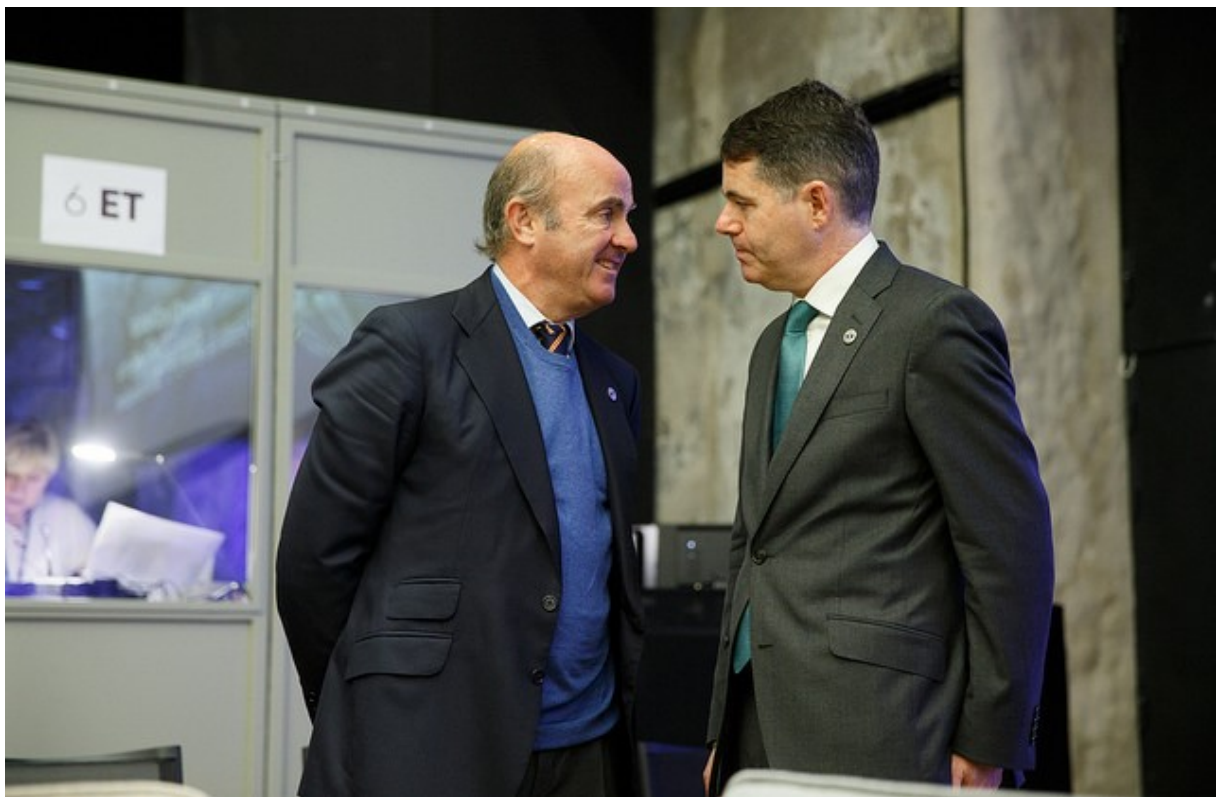
De Guindos (Spania) og Donohue (Irland).

I forbindelse med ECOFIN-møtet ble det varslet at Kommisjonen innen kort tid ville legge fram en rapport som spenner ut mulighetsrommet for digital økonomi og skatt. Kommisjonens melding om et rettferdig og effektivt skattesystem for det digitale indre marked ble lagt fram 21. september. Innholdet i Kommisjonens melding er i stor grad i overensstemmelse med formannskapets dokument som stod på ECOFIN-møtets agenda. Det er naturlig å tolke meldingen som en støtteerklæring fra Kommisjonen. Kommisjonens melding er også omtalt et annet sted i dette nummeret av Økonominytt.