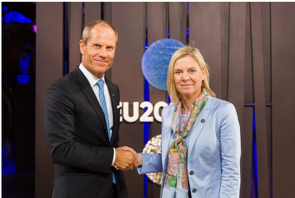
Finansminister Tõniste (Estland) og finansminister Andersson (Sverige)

Finansministrene drøftet også hvordan EU-budsjettet bedre kunne bidra til å dekke til å klargjøre land for euromedlemskap. I denne forbindelse ble muligheten for å styrke kondisjonaliteten ved utbetalingen av strukturfondsmidler trukket frem. Kommisjonen ble bedt om å komme med forslag til oppfølging.