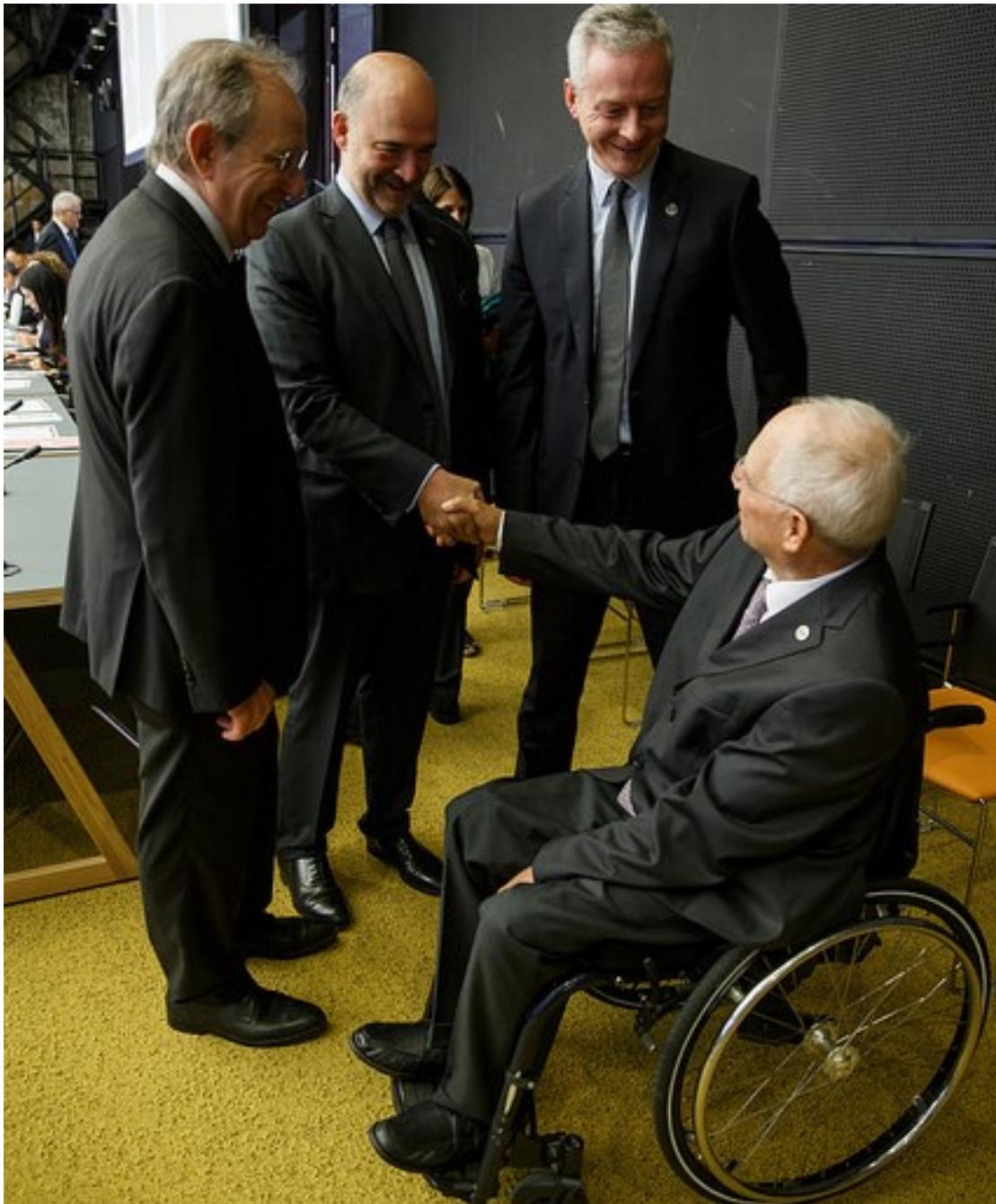
Schäuble (Tyskland) hilser på Moscovici (Kommisjonen), Padoan (Italia) og Le Maire (Frankrike).

Etter finanskrisen er det gjennomført tiltak på en rekke områder for å styrke motstandskraften, som etableringen av en felles krisefinansieringsmekanisme, arbeidet med bankunionen (som skal stå ferdig i 2024), kapitalmarkedsunionen (som skal være ferdig i 2019) og strukturreformer på en rekke områder.