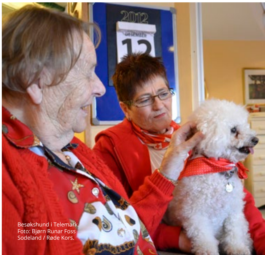
Besøkshund i Telemark.

Partene vil legge til rette for møteplasser mellom kommuner, frivillige organisasjoner, frivilligsentraler og frivillige enkeltpersoner der man gjennom dialog kan se behov og muligheter og stimulere til økt rekruttering av frivillige. Gjennom en helhetlig frivillighetspolitikk vil samspillet og samarbeidet mellom frivillig sektor og kommunen økes og ressurser kan tas i bruk på nye og innovative måter.