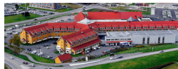
Quality Hotel & Resort