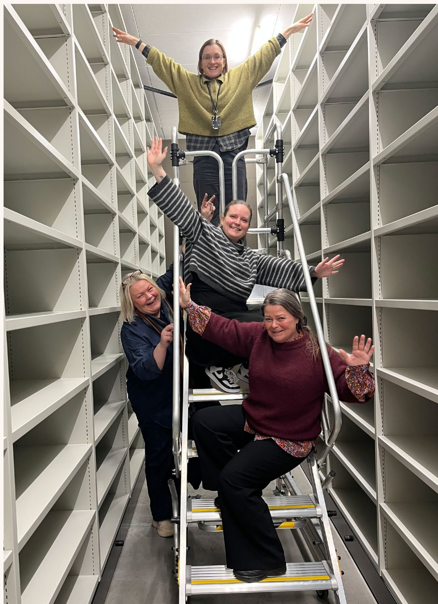
Vi har tømt magasin på Hamar