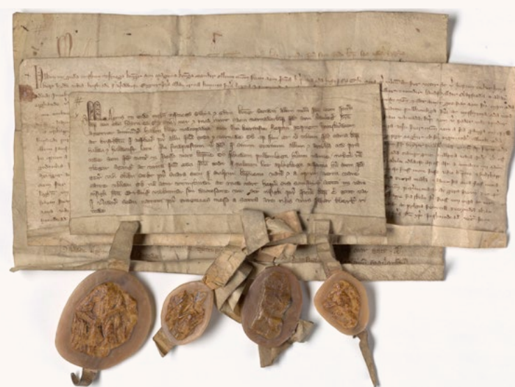
Tre brev fra hhv. 1308, 1325 og 1339 som er hefta sammen ved hjelp av segl. Arnamagnæanske diplomer, bevart i Arkivverket

(Kultur- og likestillingsminister Lubna Jaffery i Nasjonalarkivets pressemelding 21. januar 2026)