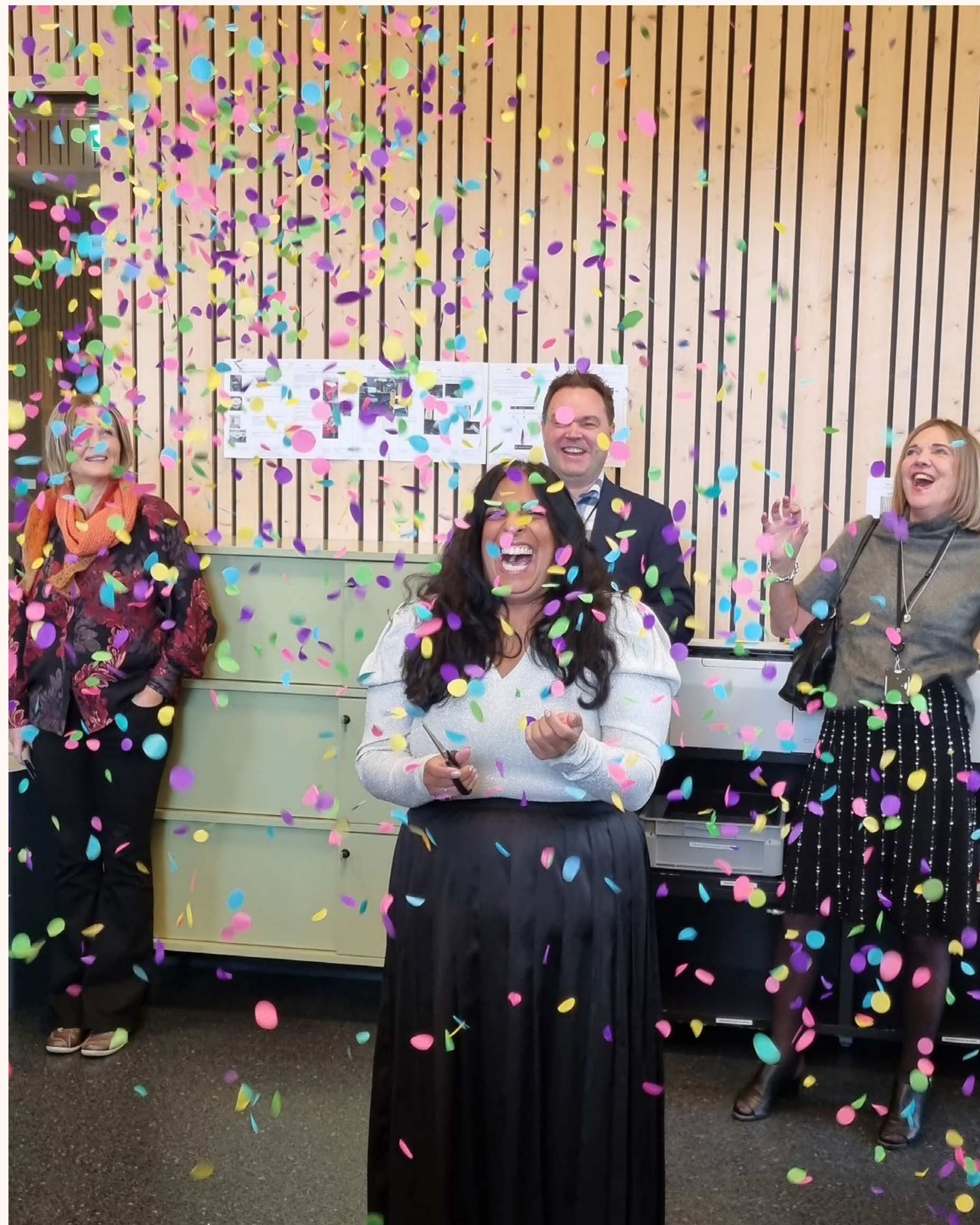
Kultur- og likestillingsminister Lubna Jaffery deltok ved oppstarten av ny digitaliserings- løype på Tynset i 2025

Vi har kartlagt behovene og etablert et bedre grunnlag for styring av digitaliseringsprosessen. Produksjonen ble startet opp i liten skala for å teste arbeidsflyt, kvalitet og ressursbruk før vi øker den. Testene viser at standardiserte formater gir høyere tempo, og at enkelte material-