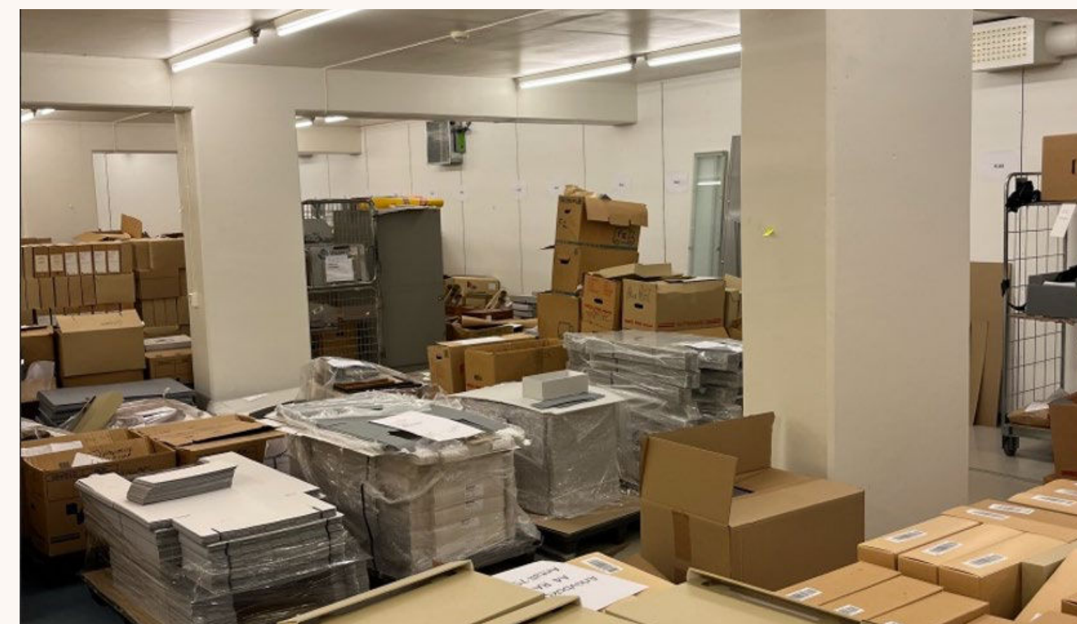
Rydding på Sognsvann

gjengelige i Oslo. Vi har ryddet i magasinene og økt kapasiteten i depotet på Sognsvann med nye reoler. Dette har økt kapasiteten med 7 258 nye hyllemeter. Arkivene fra regjeringskvartalet krever mye plass, og vi har brukt mye tid og ressurser på å frigjøre rom. Dette tok kapasitet fra utviklingsarbeid med digitalt skapte arkiv.