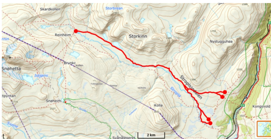
Figur: Stier i Stroplsjødalen inn til Reinheim turishytte.

Fjerning av merking av stier fører til mindre ferdsel og bidra til å kanalisere ferdselen til områder som medfører mindre negativ påvirkning på villreinen. Tiltaket innebærer fjerning av merking og revevegetering av deler av stiene gjennom Stroplsjødalen fra Moskusstien i øst og frem til Reinheim. Tiltaket påvirker allmennhetens ferdsel i området, og vil kreve noe midler til fjerning av stimerking og revevegetering samt informasjonstiltak. I tillegg til fysisk fjerning av dagens merkede sti, bør dette følges opp med ny informasjon på aktuelle nettstedet og i ulike kartløsninger. Tiltaket forventes å ha umiddelbar effekt på villreinen, og bedre villreinens muligheter til å bruke området og trekke gjennom det for å komme til andre deler av leveområdet sitt.