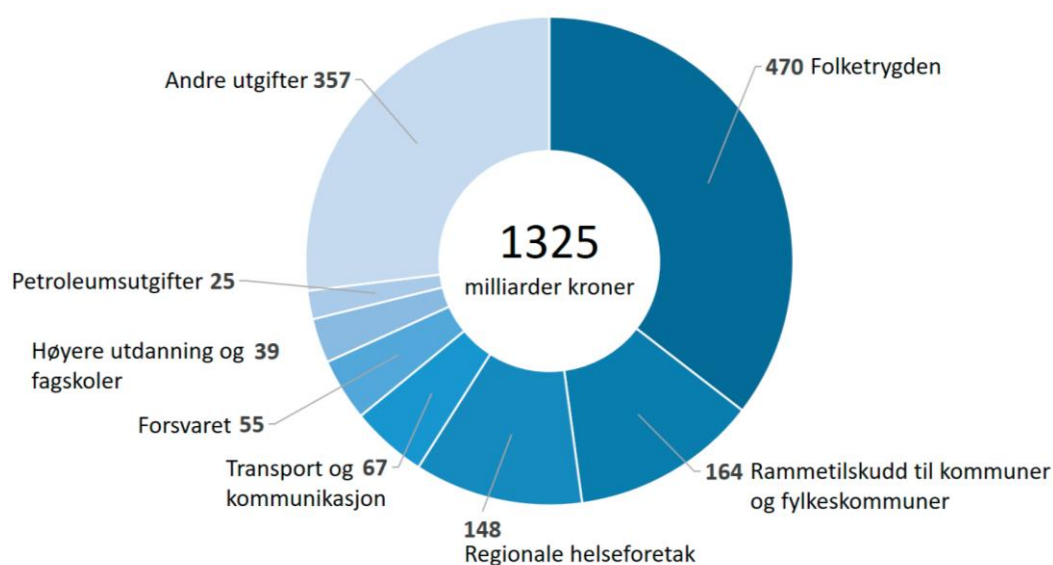
Figur 2. Utgiftene på statsbudsjettet, utenom lånetransaksjoner

Tall i milliarder kroner, uten lånetransaksjoner