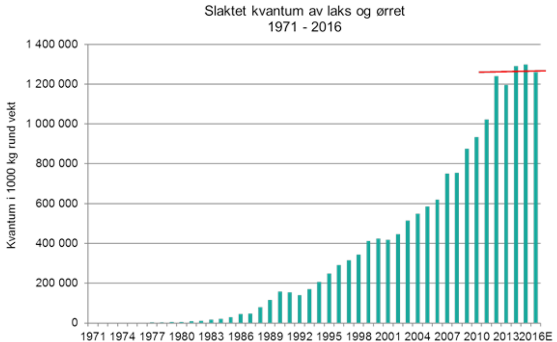
Figur 1: Utvikling i slaktet kvantum av laks og ørret i perioden 1971 – 2016.