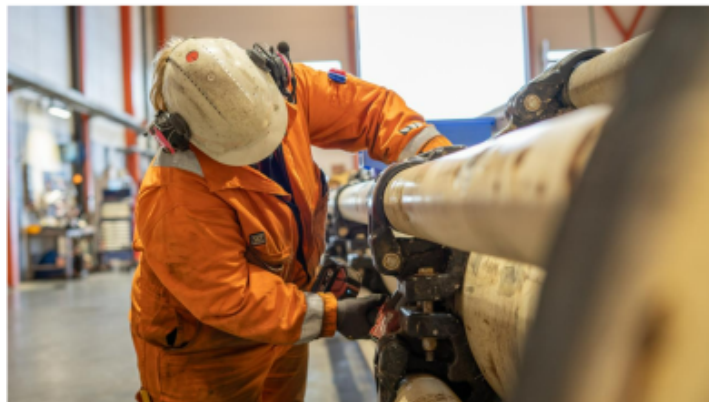
STOR KONTRAKT: Scana-eide PSW Technology har signert ny kontrakt.