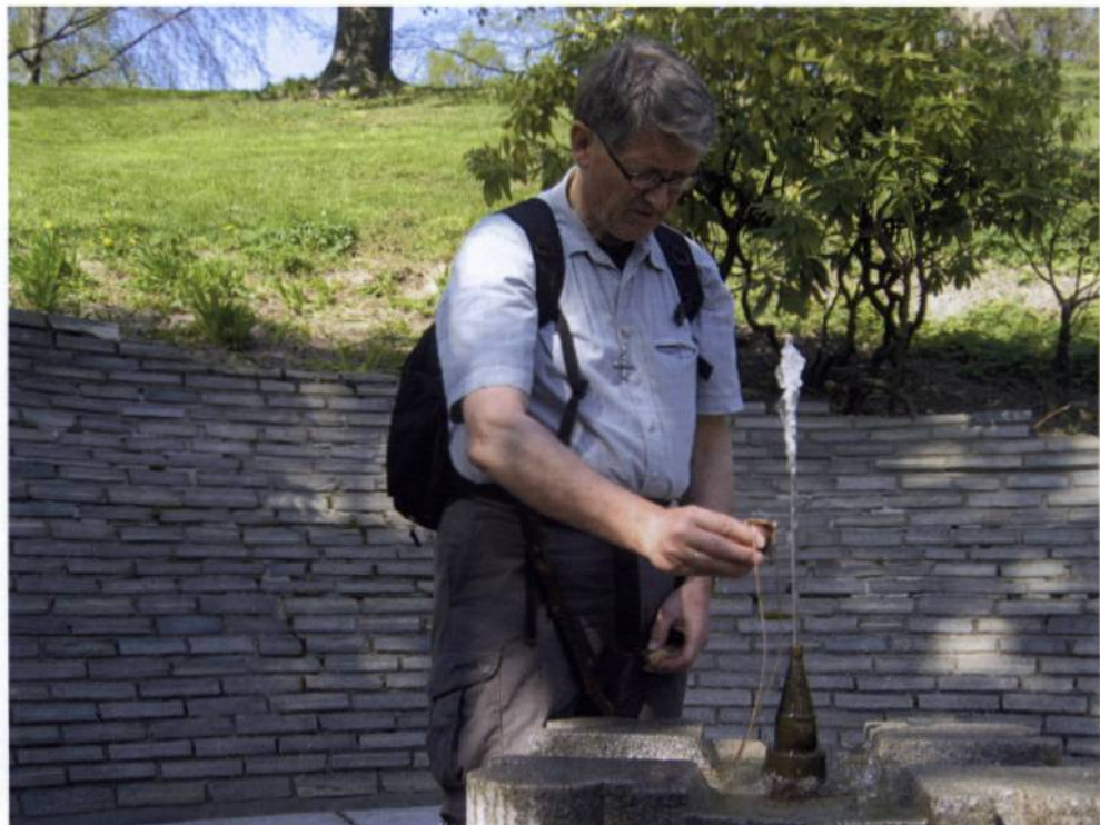
Biskop Finn Wagle avsluttet sin tjeneste i Nidaros bispedømme med en pilegrimsvandring.