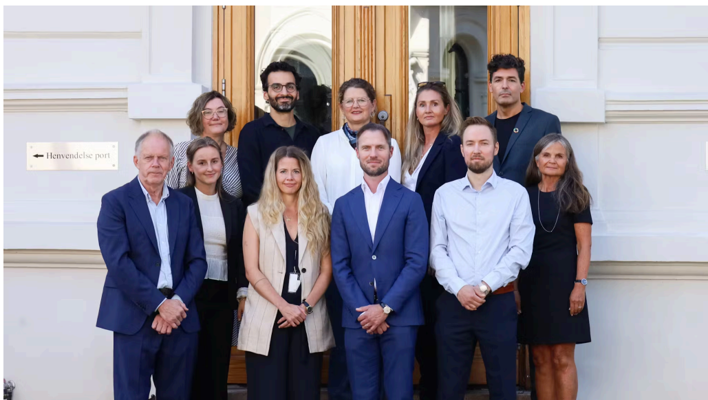
Medlemmene av Partnerdrapskommisjonen sammen med sekretariatet ved oppnevning

SRF deltar i den tverrsektorielle direktoratsgruppen om vold i nære relasjoner og vold og overgrep mot barn. SRFs deltakelse inkluderer en medarbeider fra sekretariatet. Direktoratsgruppen bidrar til økt innsikt i utfordringsbildet som er av betydning for kommisjonens arbeid og er en egnet arena for kunnskapsutveksling på området.