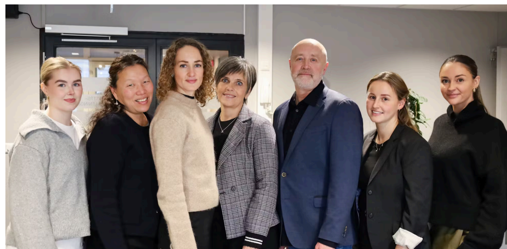
Lederne av Tilsynsrådet for kriminalomsorgen sammen med sekretariatet i SRF.

Sekretariatet er samlokalisert med Kontoret for voldsoffererstatning i Vardø. SRF gjennomførte en rekrutteringsprosess til sekretariatet i 2024. Dette resulterte i én ny fast medarbeider i sekretariatet. I tillegg består sekretariatet av tre erfarne medarbeidere i SRF som etter en intern mobilisering, vil arbeide i Vardø i inntil ett år. Ved utgangen av 2024 pågår en ny rekrutteringsrunde med sikte på å fylle flere faste stillinger i sekretariatet for Tilsynsrådet.