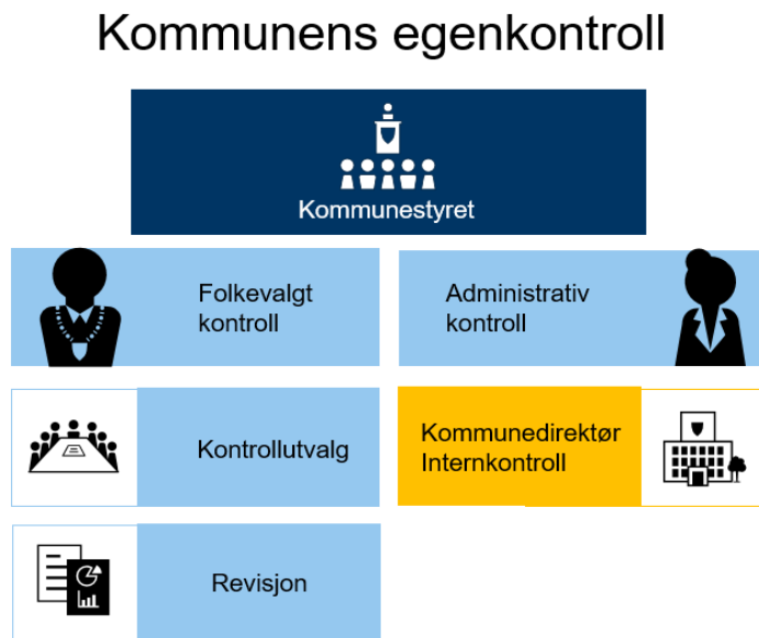
Figur 1.2 Internkontrollens plass i kommunens egenkontroll

Internkontroll er en del av kommunens samlede egenkontroll, det vil si den kontrollen kommunen fører med egen virksomhet. Internkontrollen utgjør den administrative delen av egenkontrollen, og styres av kommunedirektøren. Dette i motsetning til den folkevalgte delen av egenkontrollen, som er lagt til kontrollutvalget.