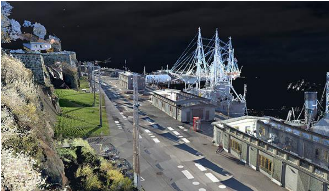
Eksempel på punktsky med fargeinformasjon av kaiområdet nedenfor Akershus festning i Oslo. I bakgrunnen kan man se Christian Radich.