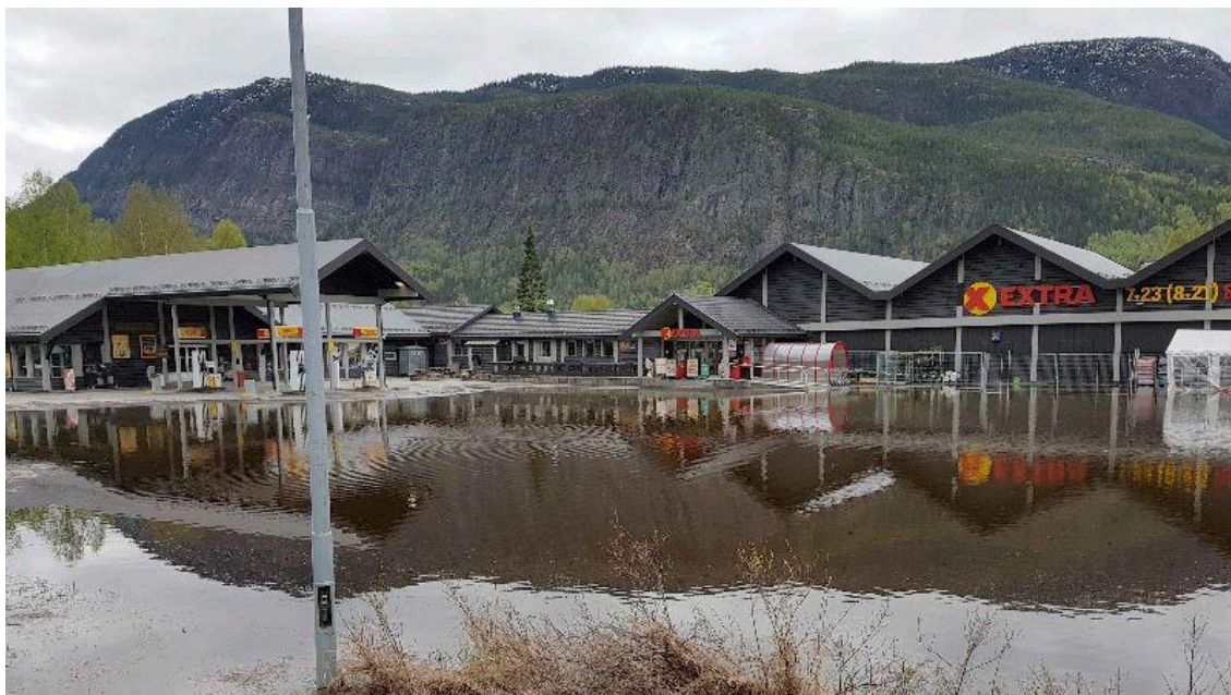
Fra flommen på Nesbyen i 2018