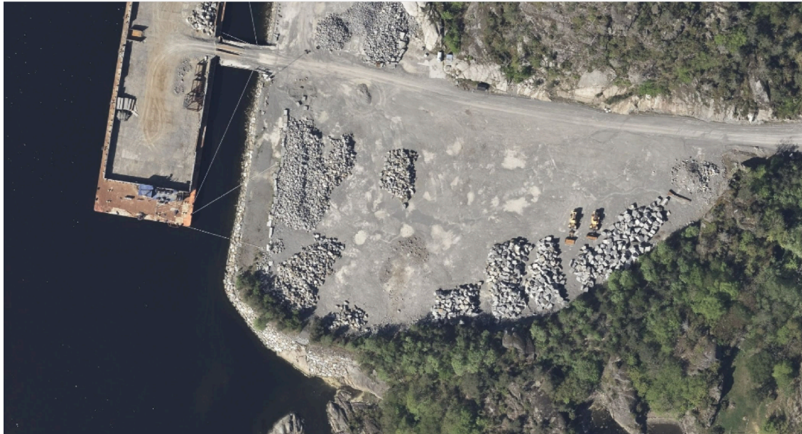
Svartebukt havn ved Mørjefjorden for utskipping av larvikitt.