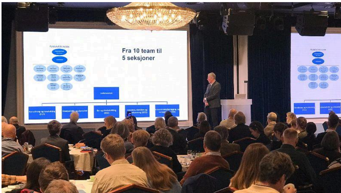
Fra nettverkssamling for regional og kommunal planlegging 2022.