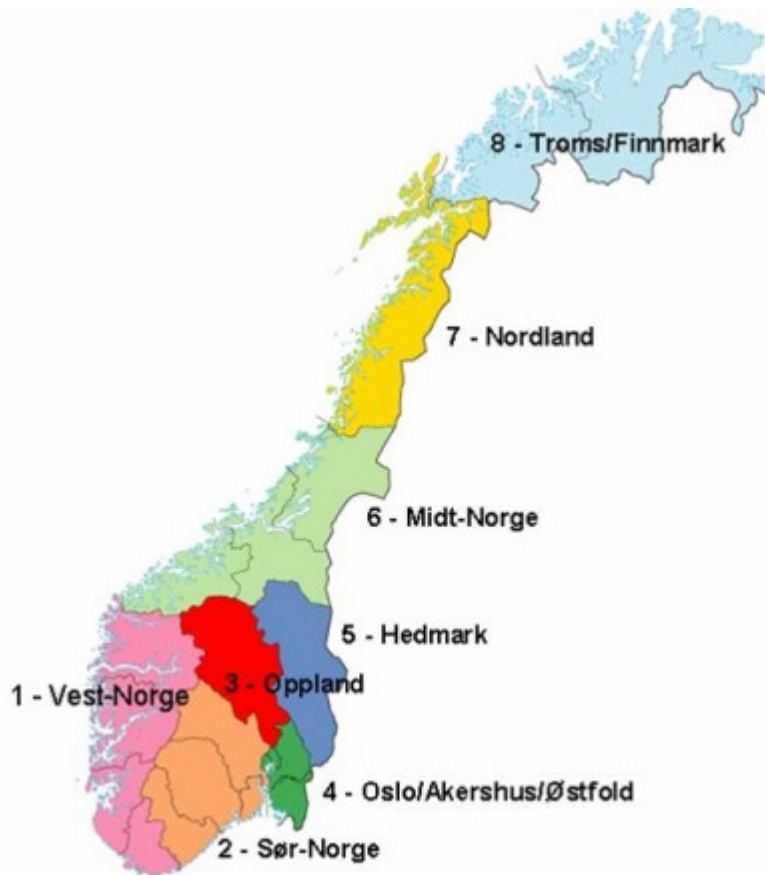
Fig. 1.0. Inndelingen av forvaltningsregionene.

Som grunnlag for inndelingene ligger utbredelsen av dagens bestander, konfliktvurderinger og en faglig, relevant og meningsfylt bestandsforvaltning til grunn. I Stortingsmelding nr. 15 (2003-2004) legges det også til grunn at eksisterende politiske målsettinger og at det fortsatt vil være mulig med en geografisk differensiert forvaltning innenfor de ulike regionene. I Innst. S. nr. 174 (2003-2004) legges det opp til at forvaltningen av ulv må behandles på en særegen måte. Forvaltningen av ulv kan skje på regionalt nivå, men at regioner som er berørt av ulvesonen, skal samarbeide om forvaltningen.