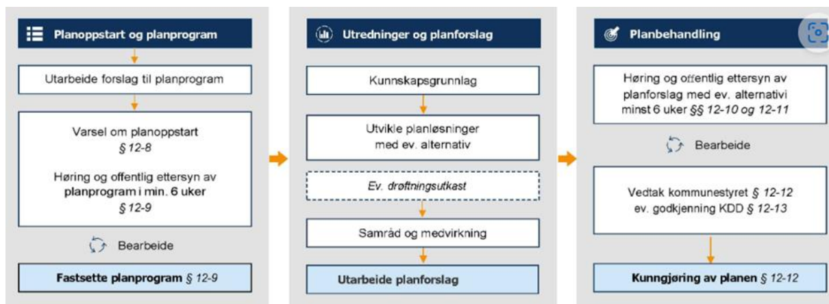
Figur 2: Grafisk framstilling av kunnskapsgrunnlag i reguleringsplan.