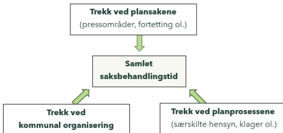
Figur 3: Tre kategorier av forhold som vi vurderer har betydning for saksbehandlingstid.

Figur 1 viser de tre hovedkategorier av forhold knyttet til kommunenes saksbehandlingstid som er undersøkt; trekk ved henholdsvis sakene og avklaringene som inngår i prosessen , samt om forskjeller i kommunal organisering har noe å si for saksbehandlingstiden.