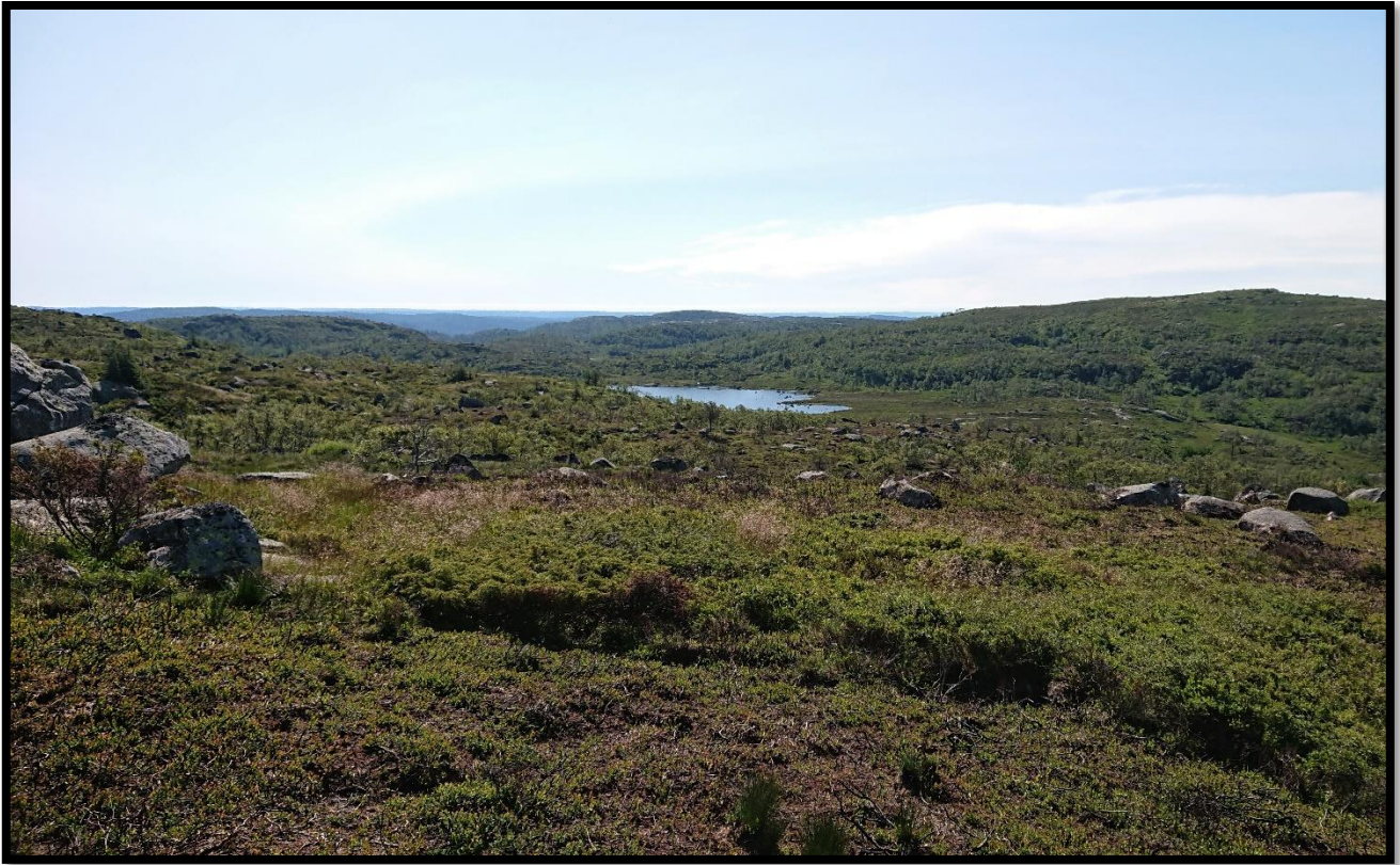
Ovenfor viser en liten del av Barnevandringsstien fra 1 etappe fra Kvineheia. Kart over 1 etappe fra Årli i Kvinedal til Snartemo i Hægebostad nedenfor.