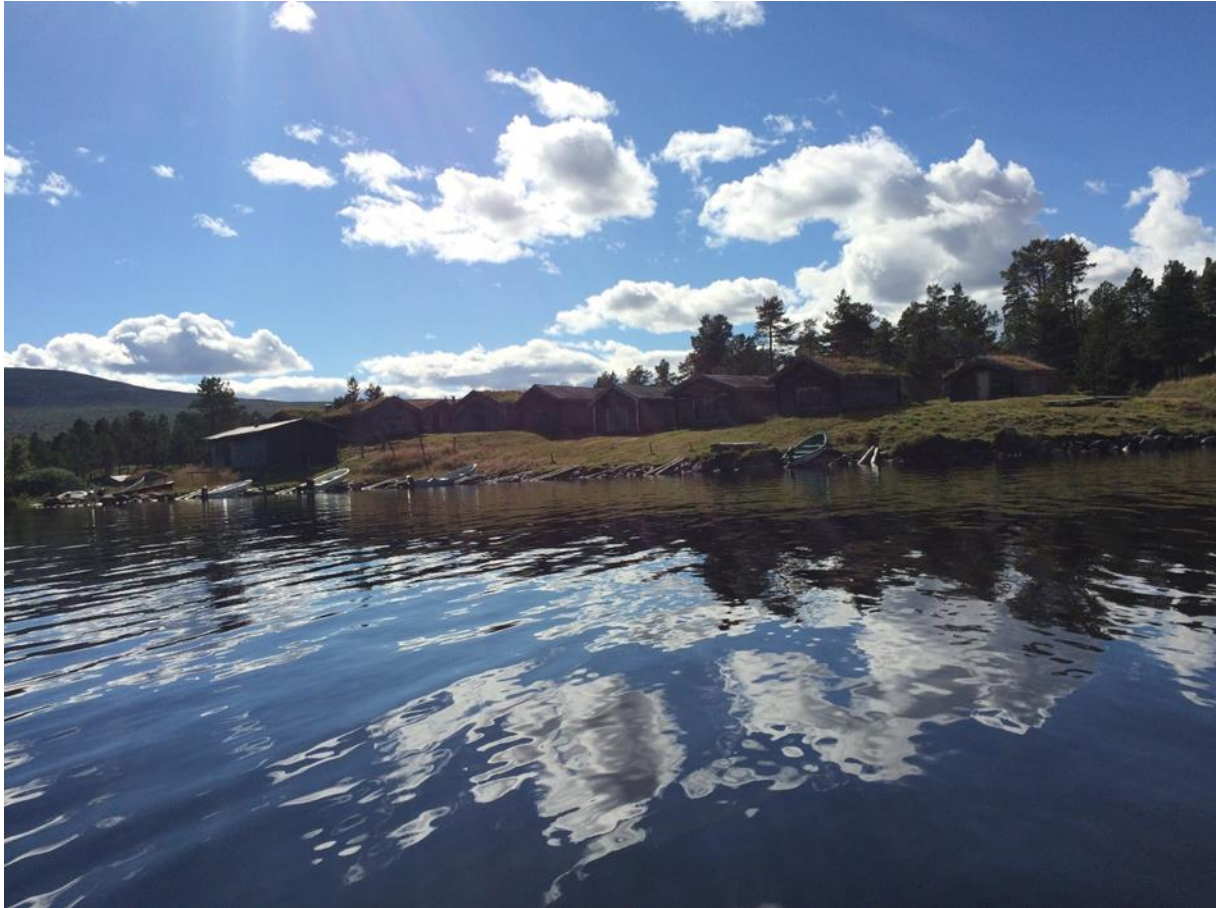
Bilde fra Fiskevollen