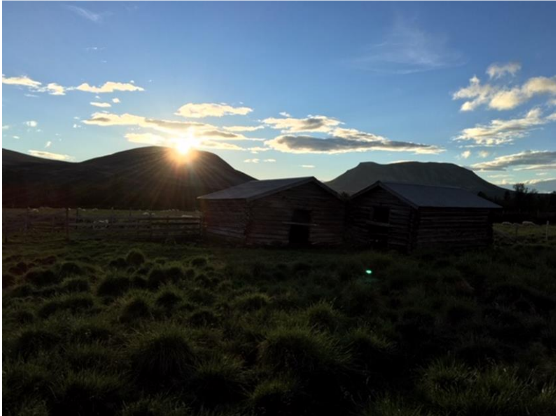
Bilde fra Klettdalen/Kåsa