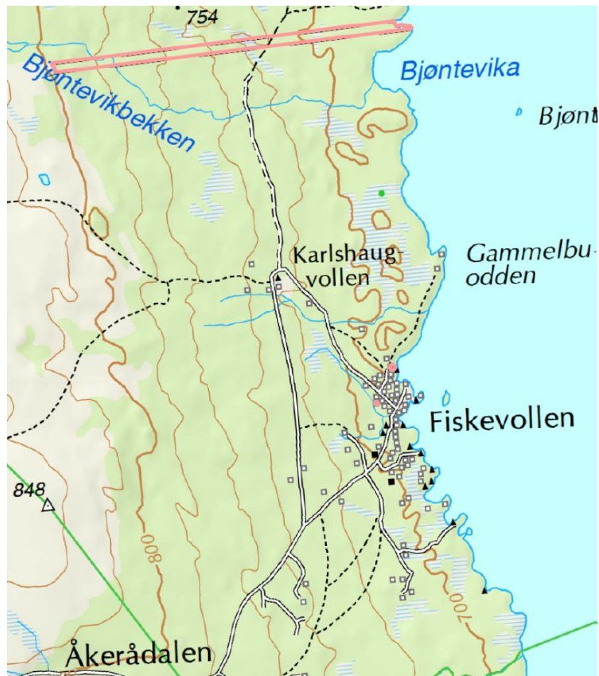
Kart over Fiskevollen og tilhørende skogteig

Vi tilbringer mye tid på Fiskevollen og i fjellområdene rundt, både sommer og vinter. Er det noe vi virkelig setter pris på så er det den uberørte storslåtte naturen. Helhetsbilde vi har av området i dag vil bli endret og en utbygging vil bli særlig synlig fra båt ute på sjøen. Dette vil kunne virke ruvende i et sjeldent kulturminne.