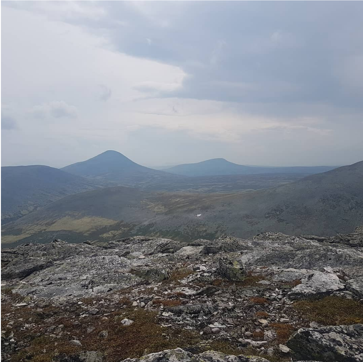
Foto: Elgpiggen sett fra Svartdalshøgda.

Avsender: Hodalen bygdekvinnelag, Hodalen i Tolga.