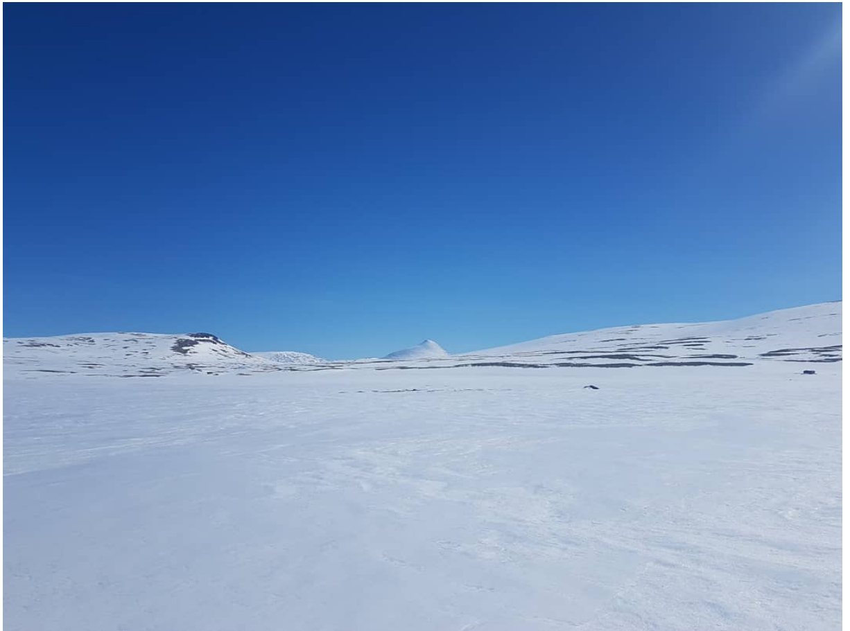
Elgpiggen sett fra Storbekkfatet i Tolga Østfjell.